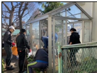
不用品や雑草の刈り取り