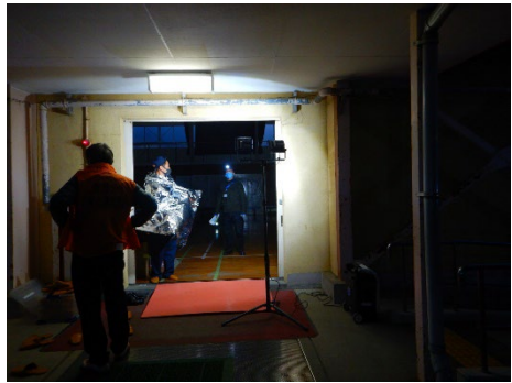
夜は寒く暗いです。 小さい段差でも要注意！