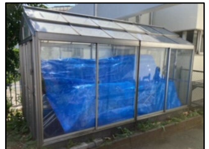
備蓄庫に入りきれない資機材 がきれいに入りました！