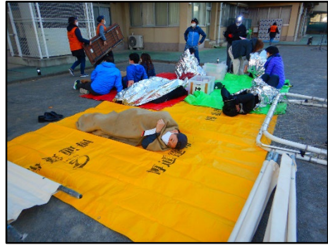
負傷者のトリアージ※