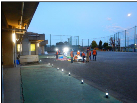
発電機やランタンを使用して 照明機器の確認