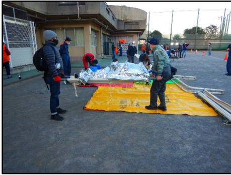
担架を使用した搬送訓練

実災害に近づけた訓練を実施！ 負傷者の想定や夜間に実施することでいろいろな課題が見えてきます！