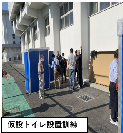
仮設トイレ設置訓練