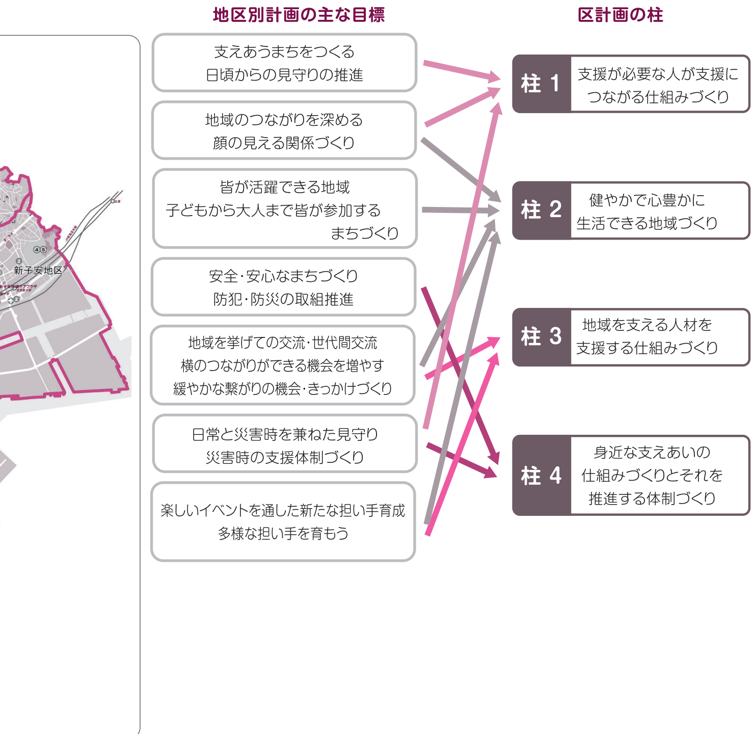
【地区別計画と区計画の関係】

なお、地区別計画策定推進懇談会で把握された各地区に共通する課題は、区計画の中にも反映させています。