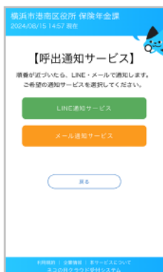
「メール通知サービス」 を選択