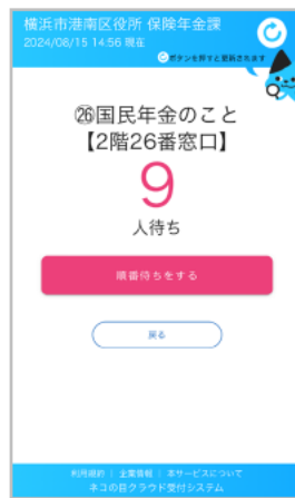
「順番待ちをする」 を選択