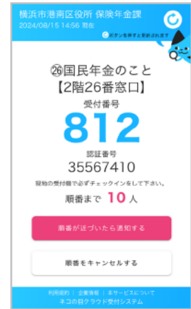
「順番が近づいたら通知する」 を選択