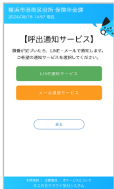
「LINE通知サービス」 を選択