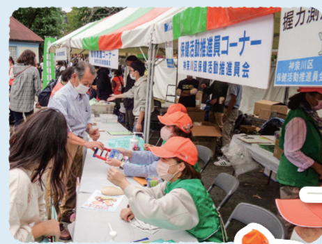
▲神奈川県民まつり