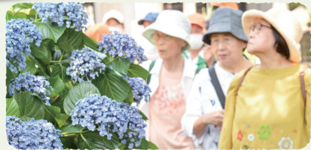
▲片倉フレッシュクラブウォーキング(片倉地区)

地域でウォーキングや体操を企画・実施しています。一緒に体を動かすと、自然と会話も弾み、心も体もリフレッシュできます。活動の予定を自治会・町内会の回覧や掲示板にお知らせしている地区もあります。