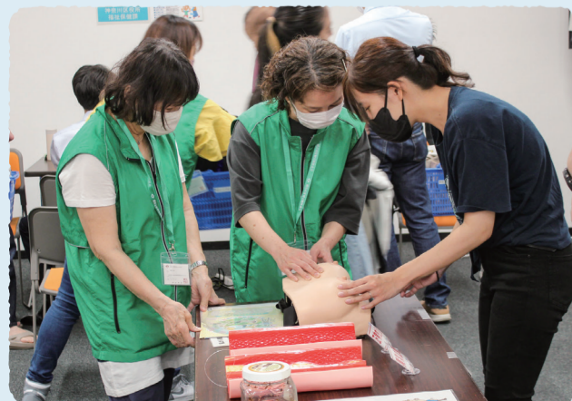
▲区役所での健康チェック

区と協働で実施している健康チェックでは、乳幼児健診で来庁した保護者向けに、乳がん触診モデルでしこりを体感してもらいました。自己触診での早期発見をPRしています。