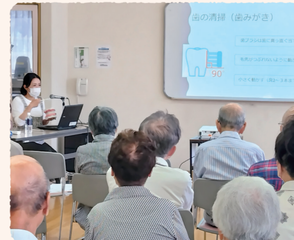
▲歯科口腔出前講座