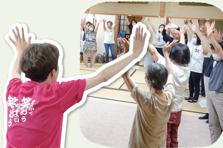
▲スクエアステップ(神奈川地区)