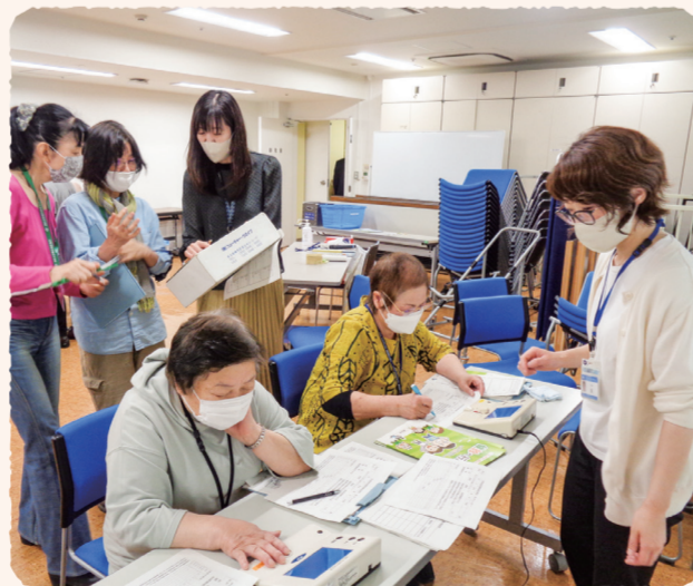
▲健康機器取扱研修

研修では、活動で使うことが多い血管年齢測定器の使い方を学びました。また、区歯科衛生士によるお口の健康を学ぶ歯科講座を地区で企画しています。