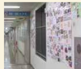
◀ 昨年のパネル展の様子

10月上旬～11月下旬、区役所3階廊下の壁面に認可保育所紹介パネルを展示します。保育所の雰囲気などを見ることができますので、ぜひご覧ください。