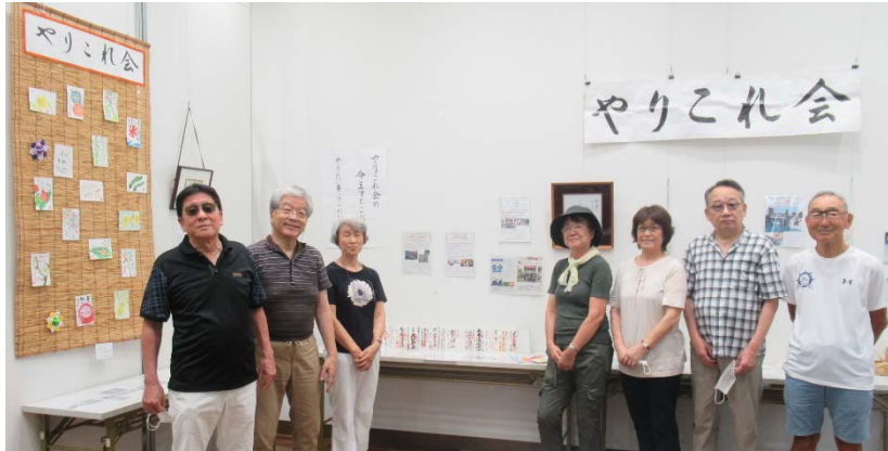
猛暑の中、区民ギャラリーの展示搬入にいらしたやりこれ会の皆さんにお話を伺いました。

病気や介護等今後起こるであろう生活の変化を考慮しながら、これからもいろいろ楽しくやっていきたいと、皆さん笑顔でした。