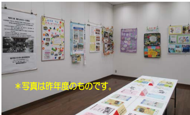
*写真は昨年度のものです。

現在、コロナウイルス感染症拡大防止のため、それぞれ工夫をしながら活動をしています。