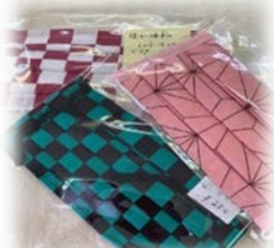
大人気の手作りマスク

物資は豊かなはずの日本で、必要なものが手に入らないという経験を、コロナ禍は運んできてしまいました。しかし、微力ながら、コミュニティーサロンが培った人脈や仕組みが地域を支えている、と実感した出来事でした。