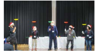
第5回 観客の前でお披露目