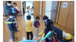
第3回 ジュピのつきいちに参加