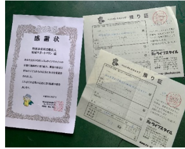
NPO 法人 Re ライフスタイルからの感謝状 エコキャップはワクチンに