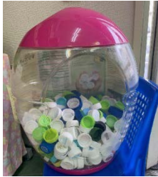
エコキャップ回収箱