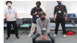
第2回 バントマイムって楽しい!