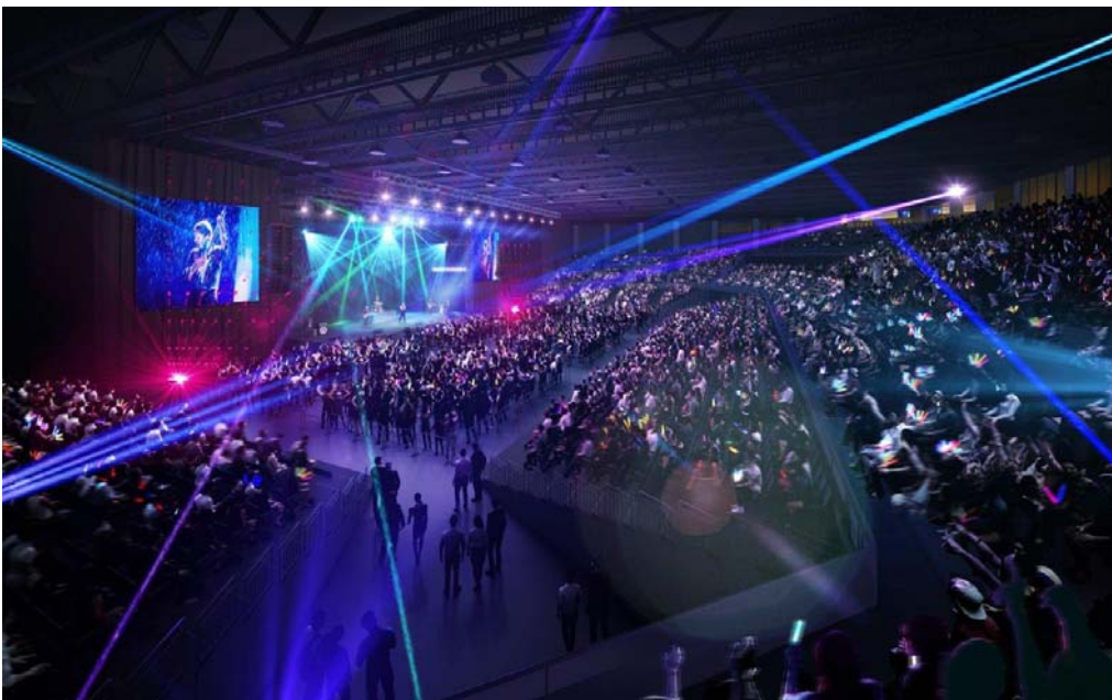
⑤内観図 (コンサート)