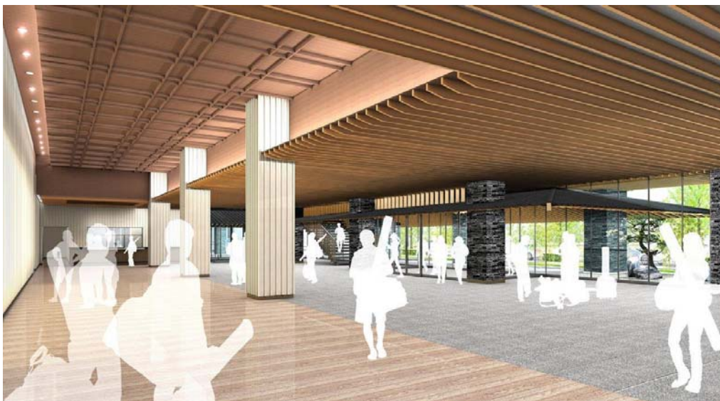
③内観図 (エントランスホール)

※上図は提案資料として提出されたものであり、実際の建物とは異なる場合があります。