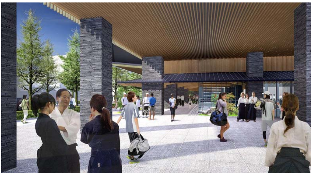
②外観図 (アプローチ部分)