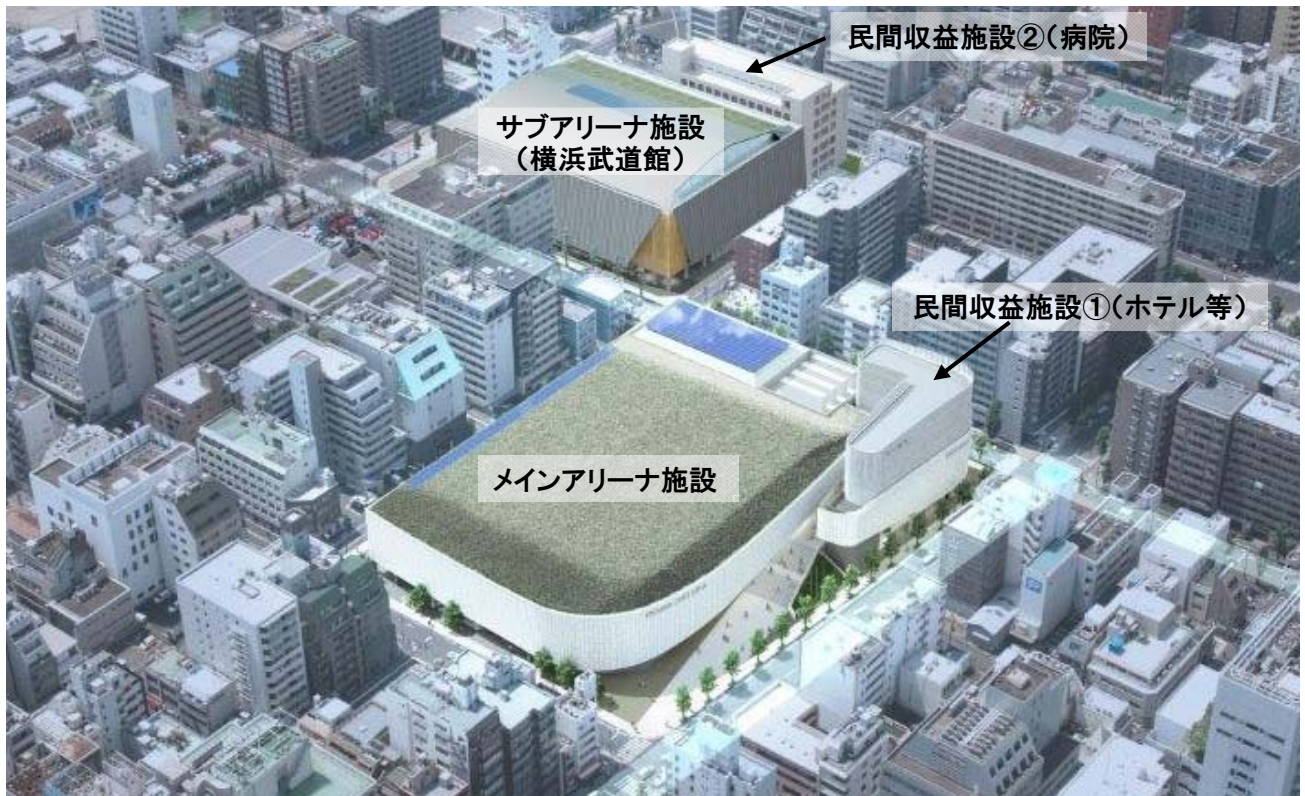
メインアリーナ施設・サブアリーナ施設 鳥瞰図

※上図は提案資料として提出されたものであり、実際の建物とは異なる場合があります。