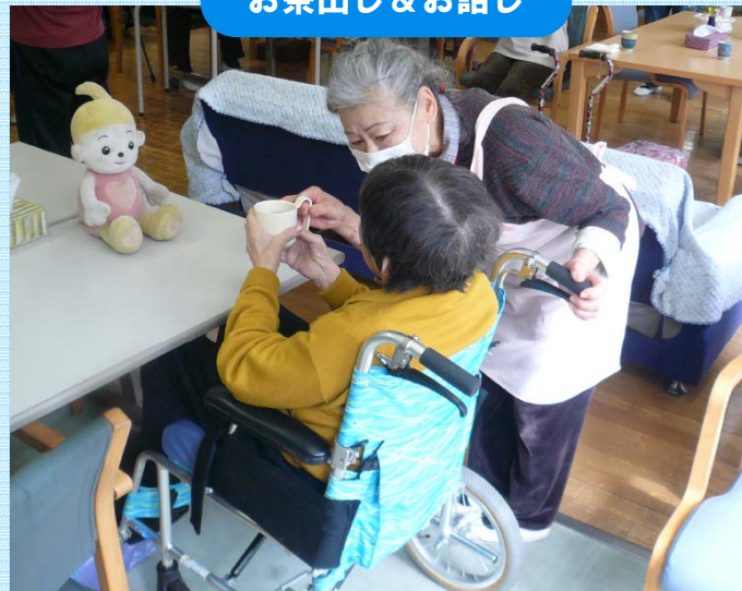
お茶出し & お話し