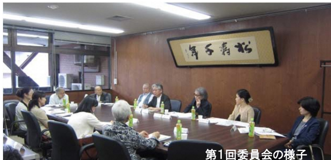
第1回委員会の様子

区民文化センターの整備にあたり、区民の皆さんにとって「身近な文化活動の拠点」となるよう、施設の基本的な方向性や、求められる機能、施設の管理運営や事業等について検討を行い、「基本構想（答申）」としてとりまとめるため、8月27日（木）に「第1回 横浜市港北区における区民文化センター基本構想検討委員会」を開催しました。