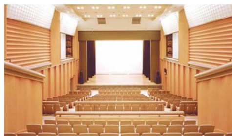
神奈川区民文化センター かなっくホール

地域に根差した個性ある文化の創造に寄与するために、横浜市区民文化センター条例に基づき設置される「 地域文化芸術活動の拠点 」です。標準的な機能としてはホール・音楽ルーム・練習室・ギャラリー・会議室・情報コーナーなどを有しています。横浜市内では現在10館の区民文化センター（旭・青葉・泉・港南・栄・神奈川・磯子・鶴見・戸塚・緑）があります。