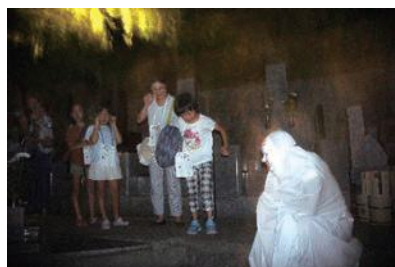
(こ、こわいよお〜キャ〜)