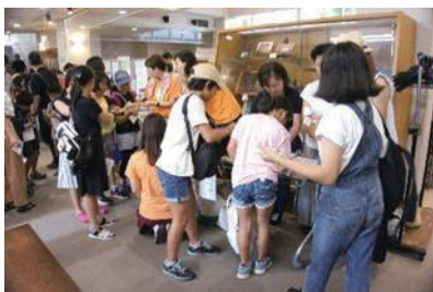
(受付で頑張るお母さんたち)