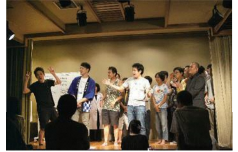
(出演者は当日までのお楽しみ♡)

振り込め詐欺防止漫才や子ども安全教室コントなど、面白くてためになる防犯活動にも発展!お笑いが地域の安全対策にも一役買っています。10月には250回記念ライブも計画中。いつでも会いに行けるお笑いアイドルとして、ツナコメの挑戦は続きます。