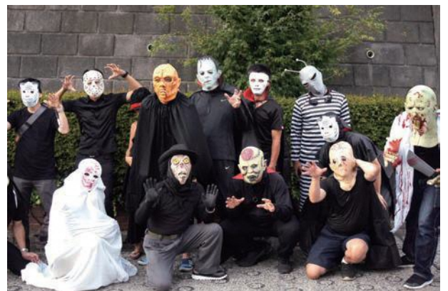
(綱島の怖あ〜いお化けたち)