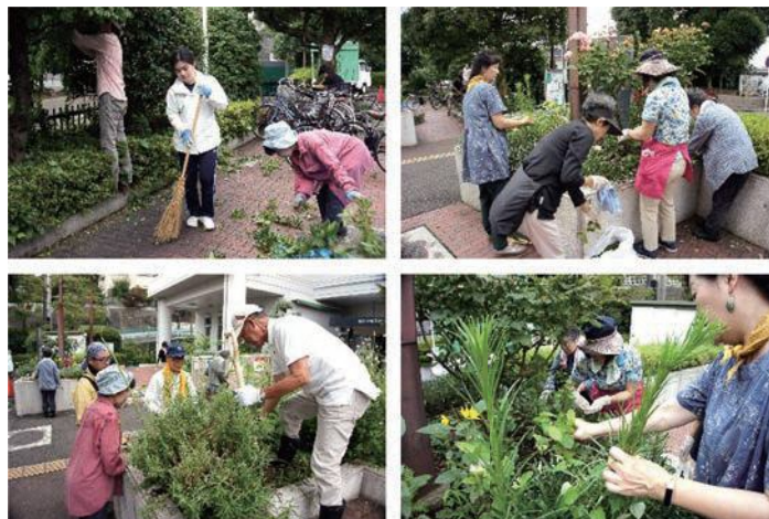
（梅雨空の下、汗をふきふき作業は進みます）

ガーデニングを通じて花や木の名前を覚え、友だちの輪が広がり、まちも自分もイキイキ元気になるステキな活動です。