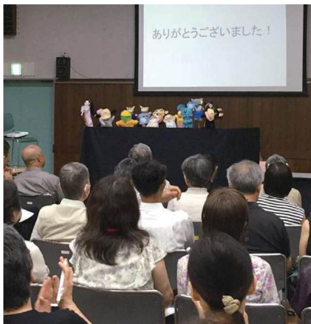
理解と助け合いを備える