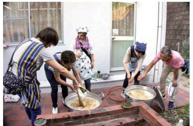
(おいしいカレーの仕込中)

当日は、まず昔の綱島・大曾根・樽町を映像でまとめたDVD鑑賞からスタート。子どもたちが地域の歴史について学ぶ機会となりました。続いて、ご当地ヒーロー横浜見聞伝スター☆ジャンが登場すると、会場内は大騒ぎ。ヒーローショーの後は、手作りカレーの夕食をいただき、満腹になった後は、いよいよ肝試しスタートです。暗闇の中を、綱島公園→ログハウス→陽林寺と巡る本格コース。とにかく、綱島のお化けは怖いんです。それもそのはず、やぶ蚊大群の攻撃を受けながら、子どもたちが来るのを今か今かとじっと待っているのですから、お化けだって大変!自然と気合も入ります。こうして、地域全体で子どもたちの育ちを見守り支えています。