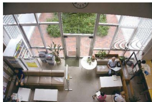
（中庭の緑を見ながらリラックスできるロビー）

綱島地区センターと言えば、なんと言っても特徴的なのが広い和室。仕切りをはずして2室合わせると60畳にもなります。舞台付きなので、歌や踊りはもちろん、お笑いライブに競技かるたなど、アイデア次第で活用の幅も広がります。娯楽コーナーには、囲碁・将棋を楽しむ方々が集い、吹き抜けのあるロビーには、ゆったりとしたソファが置かれ、新聞や本を読んだり、お友だちと歓談する姿も見られ、思い思いの過ごし方ができます。