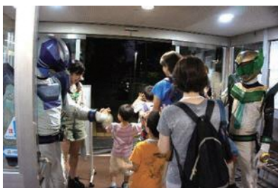
(ヒーローに見送られて出発)