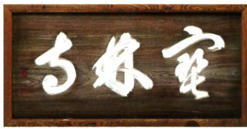
月船禅慧筆《寶林寺 扁額》江戸時代・18世紀 寶林寺

円覚寺中興の祖といわれる誠拙周樗や仙厓義梵、峨山慈禪、物先海旭といった多くの名だたる禅僧たちが集い、東輝庵を中心に地域との交流が生まれ、文化的土壌が醸成されていきました。本展は、「寶林寺東輝庵」の地に華開いた禅文化にふれるとともに近世禅林の源流をたどります。