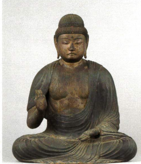
《釈迦如来坐像》平安時代・12世紀 寶林寺 横浜市指定文化財