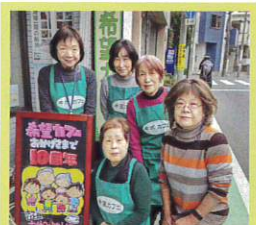
コミュニティカフェに関わる活動