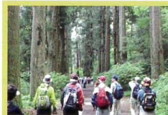
自然、歴史、文化を訪ねる

このほか 各種サークル活動や 地域で情報交換定例会など、 幅広く活動しています。