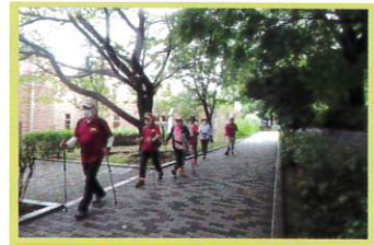
ポールウォーキングコーチ活動