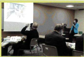
地域の講座講師活動