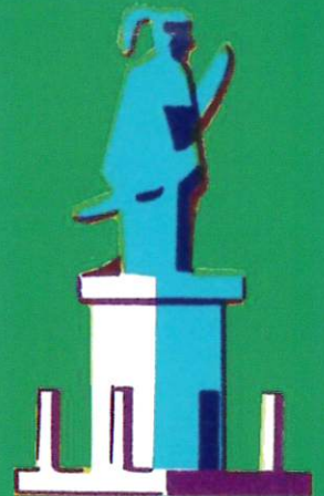
横浜市内定期遊覧バス ポスターより 1971(昭和46)年

*いただいた個人情報は、この講演会の受付とアンケート集計のみに利用し、他の目的に使用することはありません。