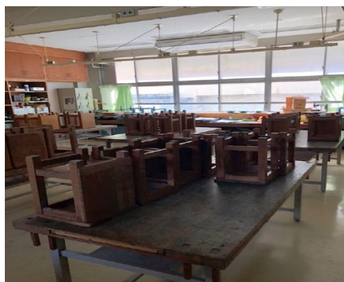
校舎内で優先利用を想定している教室見学