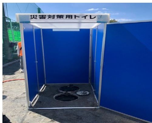
下水道直結式トイレの組立