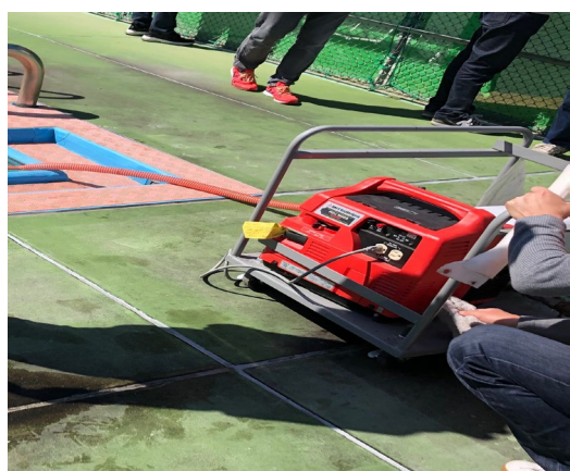
下水道直結式トイレに使用するプールの水を組むポンプの設置