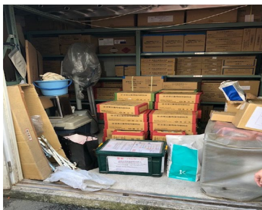
防災備蓄庫から配布食料等の取り出し