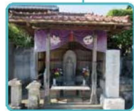
自性院 勘九郎地蔵