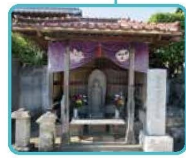
自性院 勤九郎地蔵