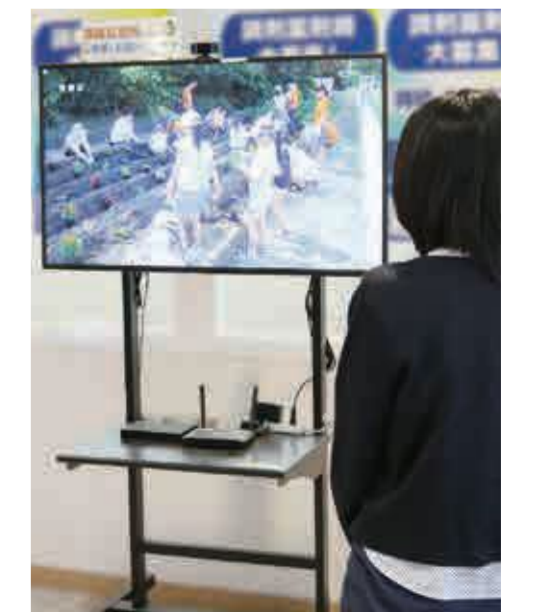
商業施設に設置のデジタルサイネージ