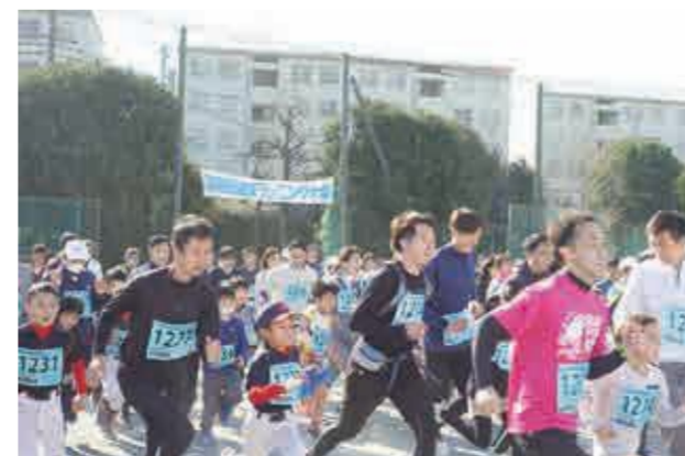
健康ランニング大会