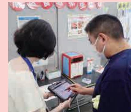
タブレット端末でアンケート