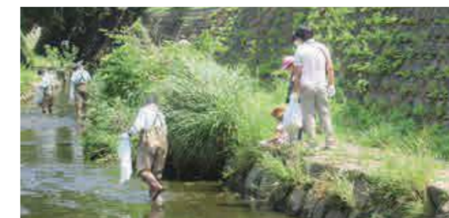
河川のクリーンアップ