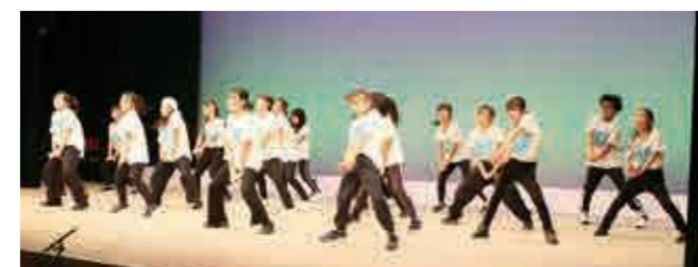
こうなん子どもゆめワールド