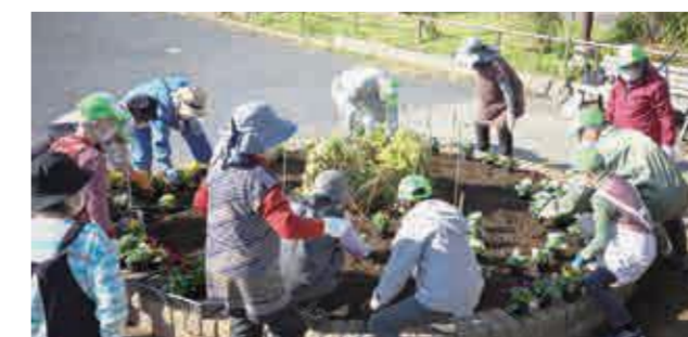
公園愛護会の美化活動