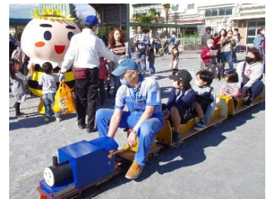
港南ひまわり83運動PRの様子

向こう三軒両隣に「お互い様」の関係ができ、いざというときにも助け合えるよう、様々な担い手による見守り・支えあいの輪が広がるような取組を進めます。