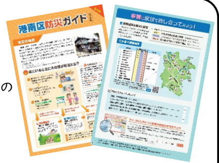
防災ガイド(中学生編)

自分の身は自分で守る「自助」、となり近所の助けあいなどの「共助」への理解が進むような啓発を積極的に行い、地域・事業者との連携により、安全・安心のまちづくりを進めます。