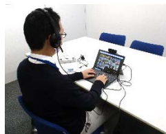
オンライン会議の活用

・これまでのような事業実施が難しくなりましたが、オンラインなど代替りの手法・新しい手法を活用しました。