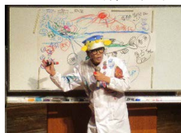
こうなん子どもゆめワールドに代わる講演会の開催

・令和3年度も、withコロナを前提として工夫をこらして柔軟に事業を進め、地域の課題解決と区民の皆さまの満足度向上に取り組めます。