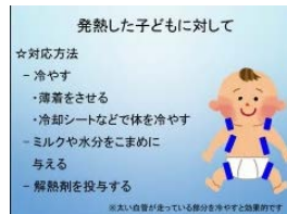
子育てに関する講演会のウェブ配信