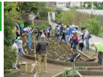
平戸永谷川クリーンアップ