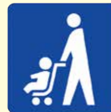
ベビーカーマーク