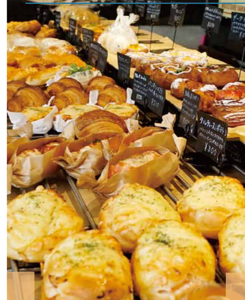
表紙写真:ブーランジェリーメリエス(地下鉄沿線のおいしいベーカリー特集より)