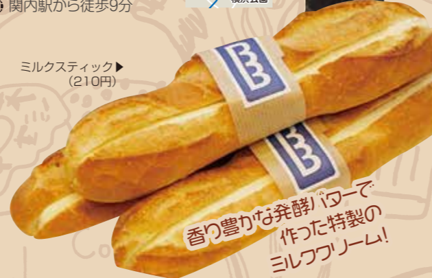
▲ミルクスティック (210円)

ニューヨークのセレクトショップをイメージしたパンやスイーツ、ペーグルを提供しています！