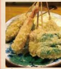
▲「串揚げおまかせセット」(800円)

ぐるっと4・5月号をご持参で、ご飲食またはテイクアウトの方に当日お楽しみ特典あり!