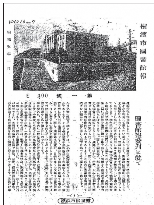
【都市横浜の記憶 追加資料より】 「横浜市図書館報 第1号 昭和5年1月」

また、既に公開している資料について目次情報の採録を行い、検索時のキーワードとして使えるようにしました。