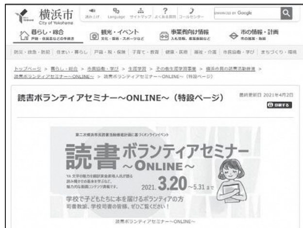
読書ボランティアセミナー～ONLINE～

図書館は、司書による初心者向けの読み聞かせレクチャーの動画を作成し、公開しました。