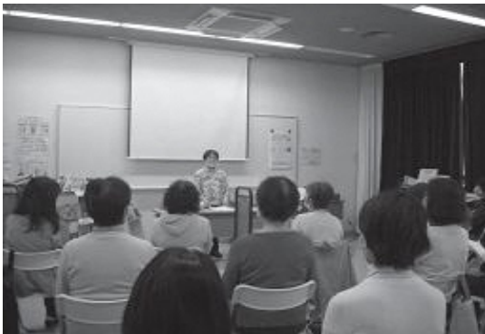
金沢図書館「わらべうたと絵本の会ボランティア講座」