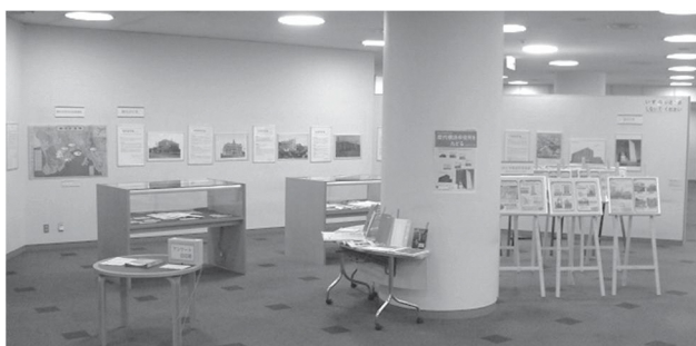
企画展示「新市庁舎開庁記念 歴代横浜市役所をたどる」

・図書館資料を活用した展示を47回実施しました。うち11回は、市役所各部署と連携し、市政のPRにも繋がりました。