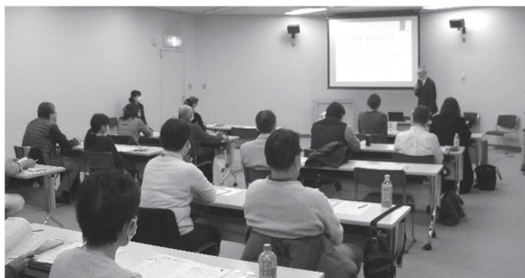
第3回ヨコハマライブラリースクール 「第2の人生で起業という選択！ 起業チャレンジセミナー」

・市民の「学び」を多角的に支援する「ライブラリースクール」では、最先端の研究成果等を学ぶ教養講座を3回、生活上の課題解決に役立つ知識を学ぶ実用講座を1回実施しました。うち3回については、ウェブ会議サービス (Zoom) を利用し、遠隔地からも参加できる方式を併用しました。