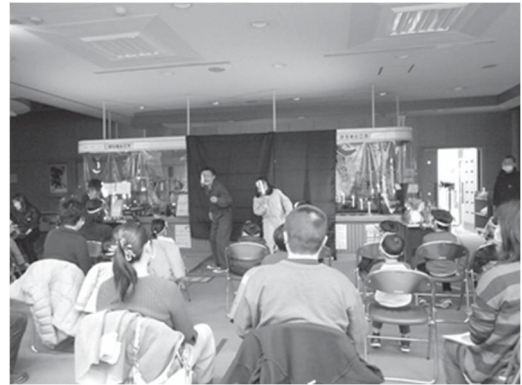
港南図書館「テアトル図書館」