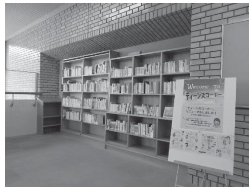
保土ヶ谷図書館 ティーンズコーナーのリニューアル