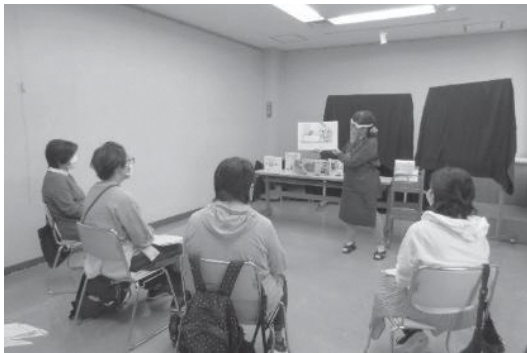
旭図書館「まずはここから！ 絵本の読み聞かせコツのコツ」