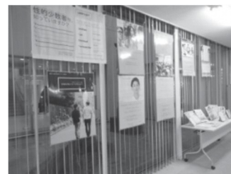
緑図書館 パネル展示 「性的少数者を知る」