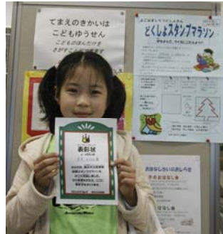
昨年の全問正解者