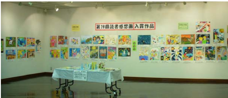
「読書感想画展」(平成20年度)より 第19回読書感想画コンクール入賞作品を展示しました。

【内容】第20回読書感想画コンクール横浜地区入賞作品を展示 します。(小・中学生の作品)