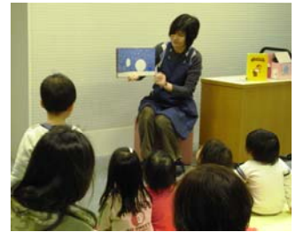
親子おはなし会の様子 (緑図書館)