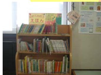
「初めて出会う絵本コーナー」では乳幼児にぴったりの絵本と出会えます。

「絵本」「ものがたり」「紙芝居」など、たくさんの子どもの本が市立図書館で皆さんを待っています。また、お子さんのいらっしゃるご家庭に役立つ本や雑誌も多くそろえています。「妊娠・出産」「離乳食」「子どもとの関わり方」「子どもの健康や病気」「保育所の案内」などの本のほか、子育てに役立つパンフレットやちらしも置いています。