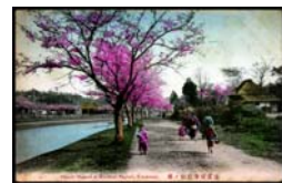
横浜根岸堀割ノ桜

[内容]明治・大正期の横浜の風景を写した絵葉書の中から、桜にちなんだものを紹介します。 [期間]2/24(金)~3/9(金)