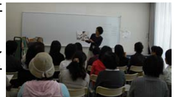
読み聞かせボランティア講座 (金沢図書館)

市立図書館では、ボランティアをこれから始める方のための講座や、すでに活動中のボランティアのための講座などを実施しています。また、ボランティアの交流会を実施している図書館もあります。