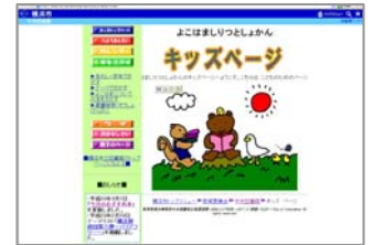
横浜市立図書館キッズページ http://www.city.yokohama.jp/me/kyoiku/library/kids/

毎月のおすすめの本や、年齢別のおすすめの本の情報を掲載しています。また、おすすめの本のリストを配布することもあります。