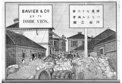
「横濱七十六番 パビエル商会 内面之図」