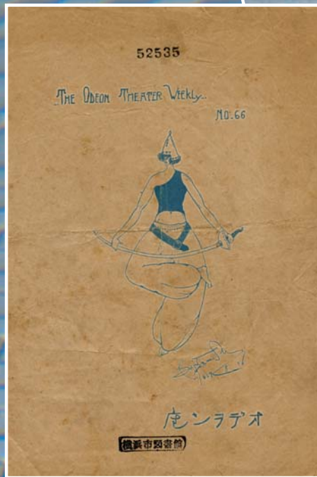
●左図 “The Odeon Theater Weekly” (オデオン座ウィークリー) No66 [1925年]