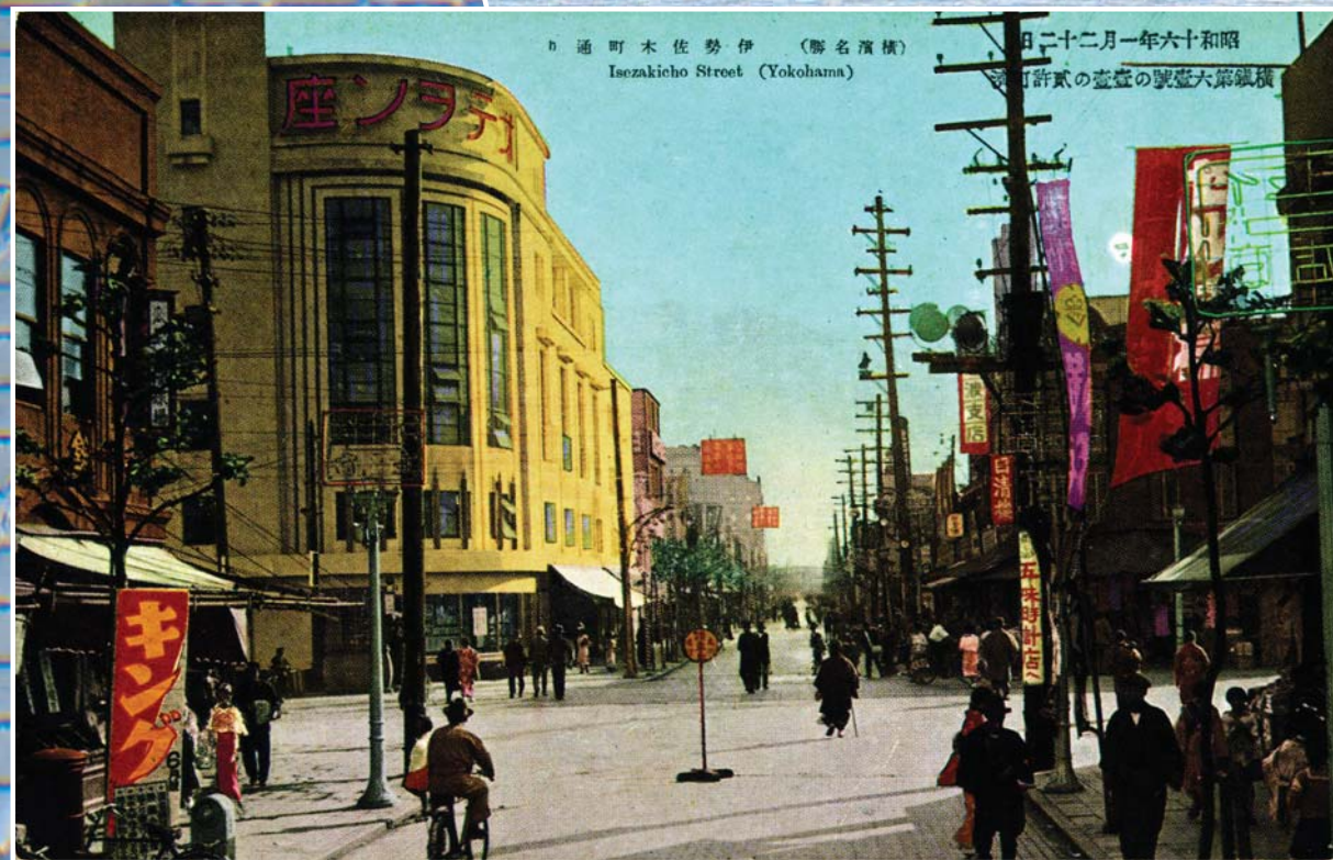
●下図 絵葉書「(横浜名勝) 伊勢佐木町通り Isezakicho Street (Yokohama) 昭和十六年一月二十二日横鎮第六壹号 の壹壹の貳許可済」