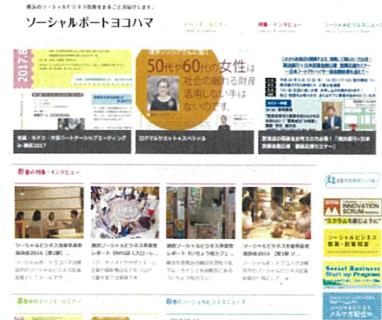
ソーシャルポートヨコハマ トップ

協働で実施することで、横浜市公式WEBサイト外での管理運営が実現し、官民含めた幅広い情報をリアルタイムで配信することで、SBに対する意識の底上げ及びSBでの起業がしやすい風土づくりを推進しました。