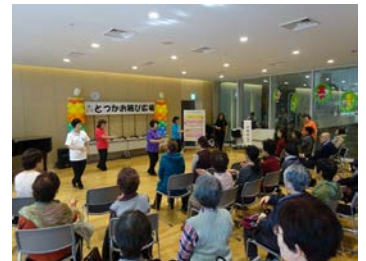
第7回とつかお結び広場

戸塚区内を中心に様々な分野で活動している地域活動団体や個人の活動内容を、パネル・活動体験・ステージパフォーマンス等を通して紹介するイベントを開催しました。企画・運営は公募で集まった運営委員の方々により行われ、来場者に地域活動への参加のきっかけを作ることや、活動団体同士の交流につながりました。