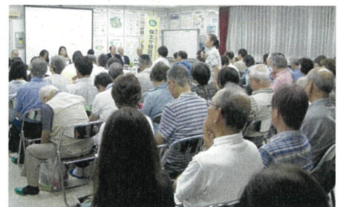
「地域のつどい」の様子