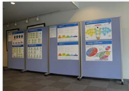
学生によるデータビジュアライズの掲示の様子