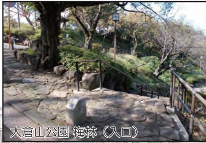
大倉山公園 梅林（入口）