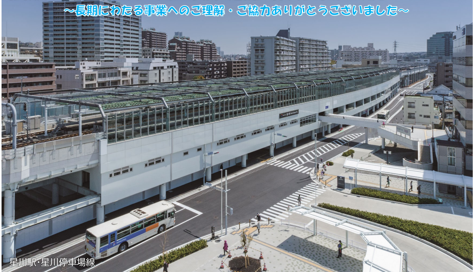
星川駅・星川停車場線

相模鉄道本線（星川～天王町駅）連続立体交差事業が完了しました！ ～長期にわたる事業へのご理解・ご協力ありがとうございました～