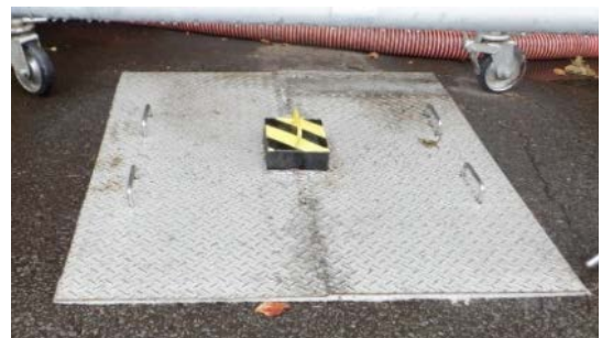
図4 ステンレス製マンホール用覆蓋