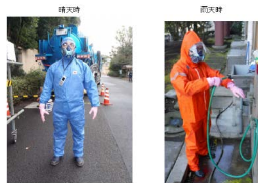
図3 防護服、マスク等の装備