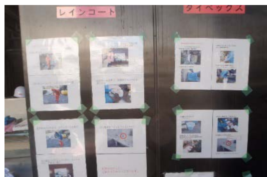
図7 写真入り作業マニュアル