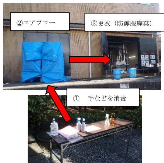
図5 作業後の感染防止対策

他局の職員を含め、職員の知識と経験を活かして多くの工夫を行い、最終的に1人の感染者も出すことなく、作業を終了できたことは大変意義のあることだと考える。