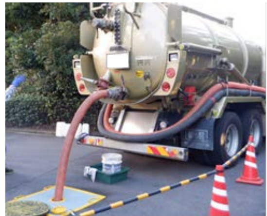
図2 マンホールへ排水作業