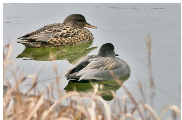
若葉台遊水池で憩うオカヨシガモ