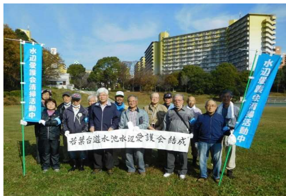
若葉台遊水池水辺愛護会結成集合写真