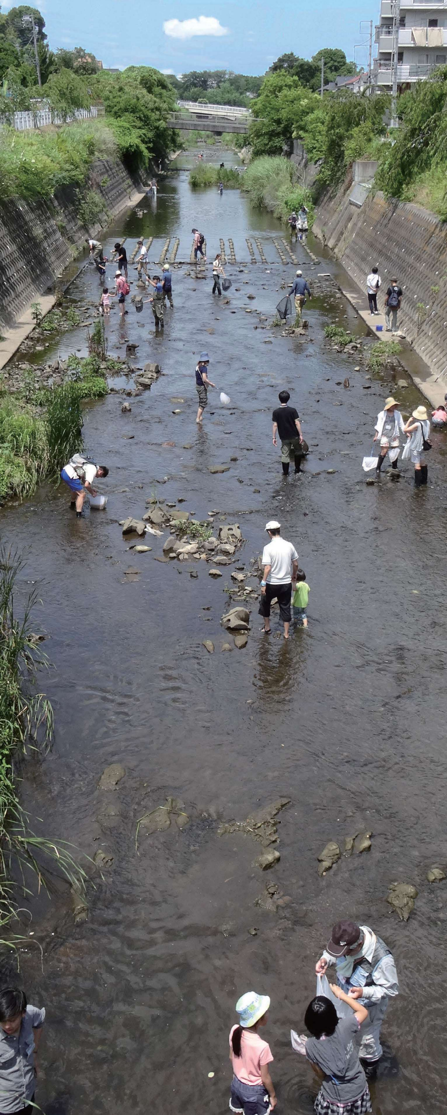
横浜市下水道河川局河川部