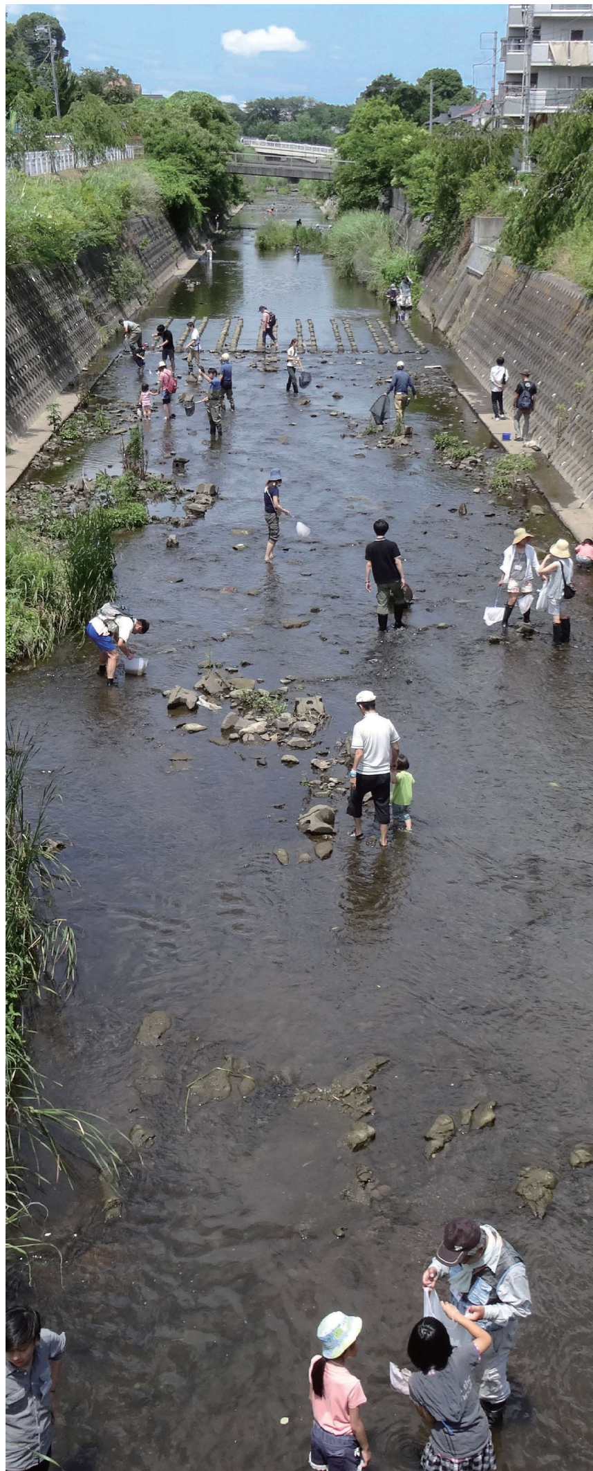
横浜市下水道河川局河川部