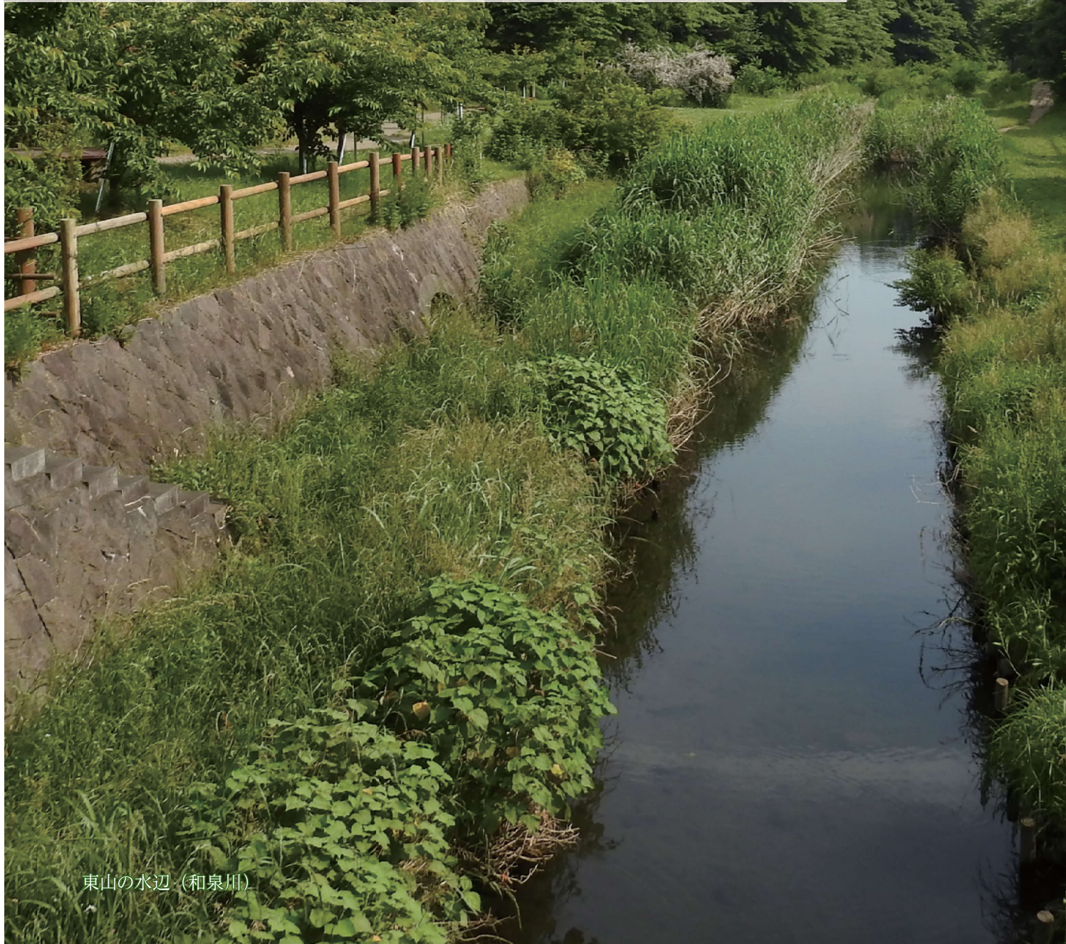
東山の水辺（和泉川）

この法律は、河川について、洪水、津波、高潮等による災害の発生が防止され、河川が適正に利用され、流水の正常な機能が維持され、及び河川環境の整備と保全がされるようにこれを総合的に管理することにより、国土の保全と開発に寄与し、もつて公共の安全を保持し、かつ、公共の福祉を増進することを目的とする。