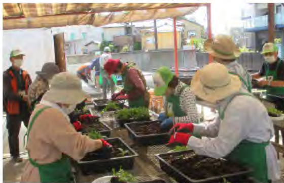
ポット上げの様子