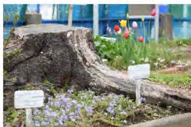
切り株を利用した花壇