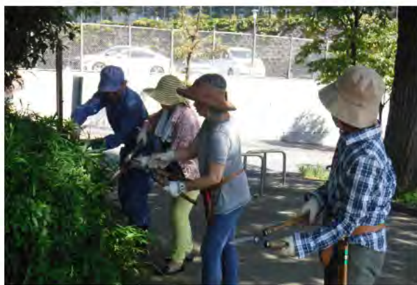
中低木の管理講習会