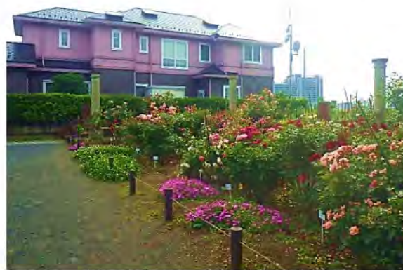
きれいなバラの花壇