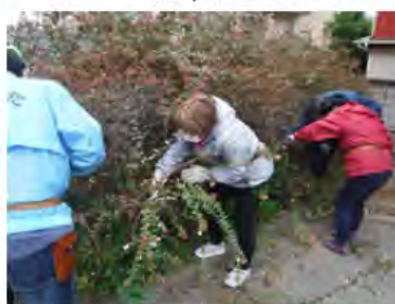
中低木の剪定 講座の様子