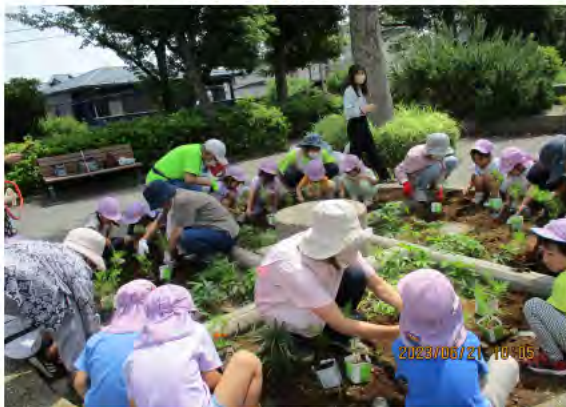
保育園児と花壇作り