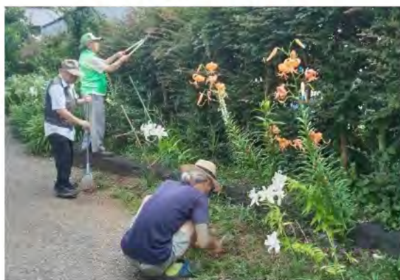
愛護会でユリの手入れをする様子