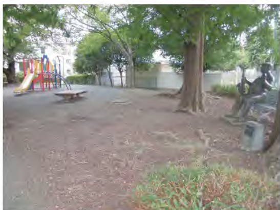
横浜彫刻展の入賞作品と複合遊具がある 通称「おじさん公園」