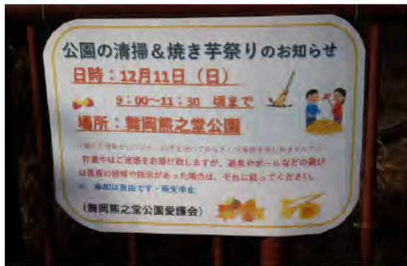
清掃とイベントの掲示