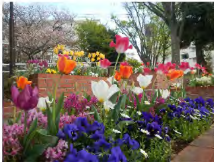
球根ミックス花壇