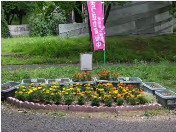
利用者を癒す花壇