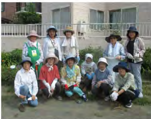
愛護会員のみなさん