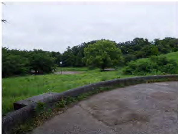
見晴らしの良い展望広場