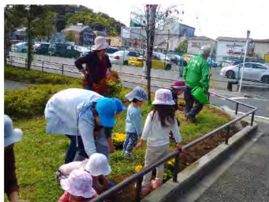
保育園児と一緒に花植えをする様子