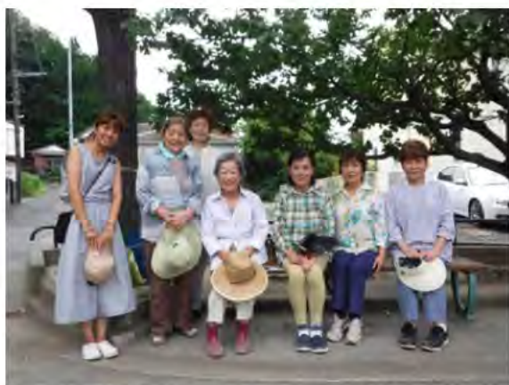
4つあるグループの1つ 金曜日グループのみなさん