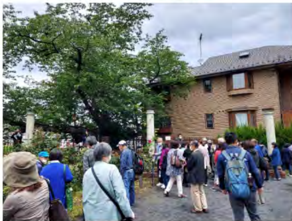
イベントにはたくさんの参加者が集まりました