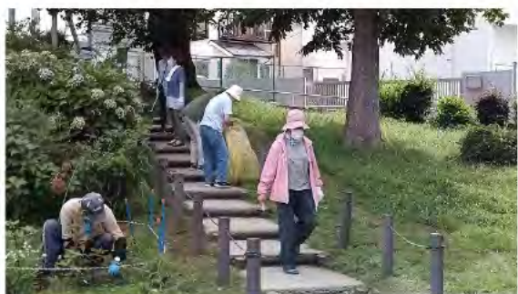
階段の周りも入念に清掃します