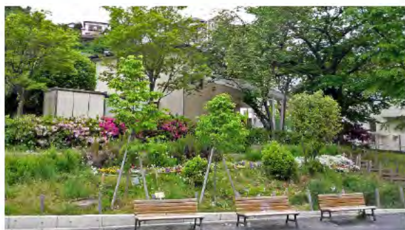
居心地の良い公園