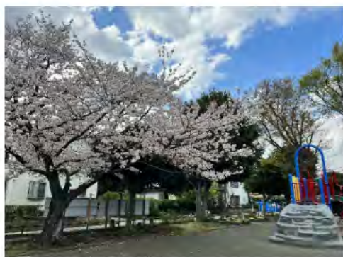
サクラが美しい公園