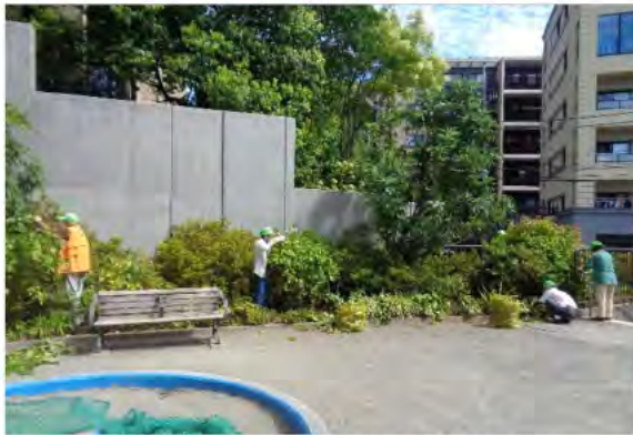
慣れた手つきであじさい剪定