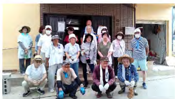
愛護会のみなさん