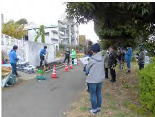
花壇づくり研修で説明を聞く様子