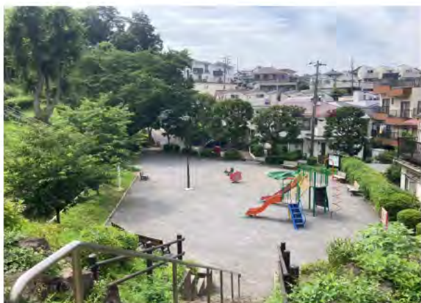
きれいに清掃された園内