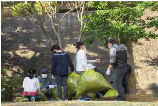
皆さんと一斉清掃