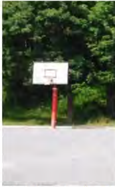
バスケットゴール