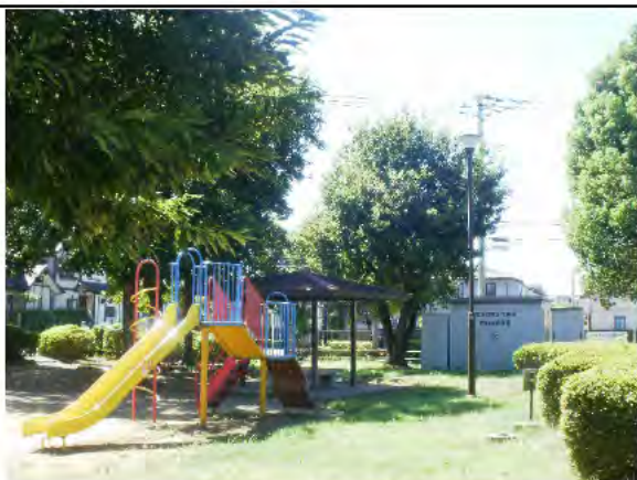
西が岡二丁目公園