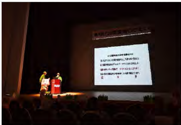
港南区公園愛護のつどい