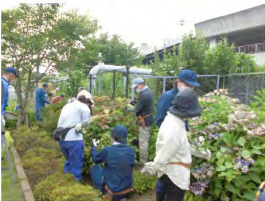
アジサイの剪定講習で実習する様子