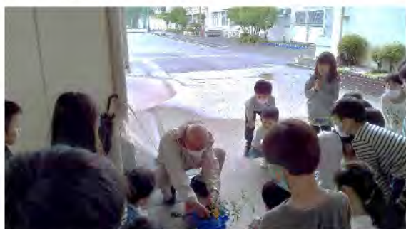
野菜の育て方を教わる子どもたち