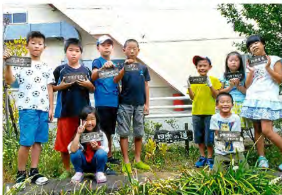
子ども達を書いた樹名板