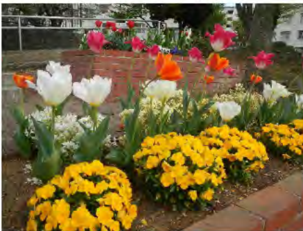
球根ミックス花壇