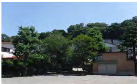
緑に囲まれた公園のようす