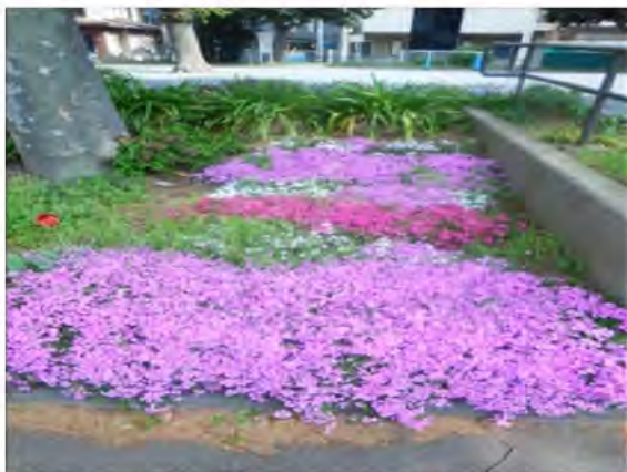
美しい花のじゅうたん