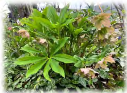
大株に育ったクリスマスローズ