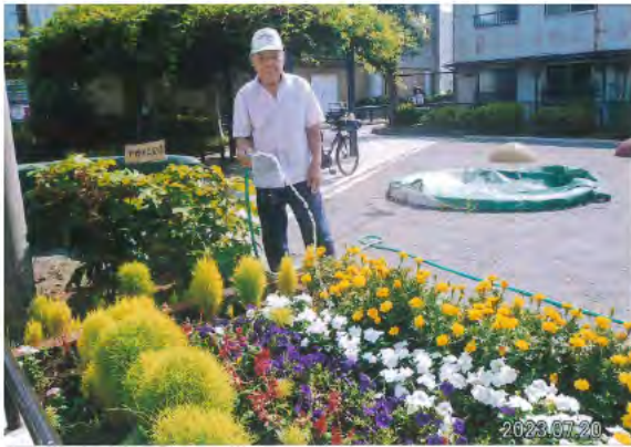
日々の水やりのおかげで美しい花壇が保たれています