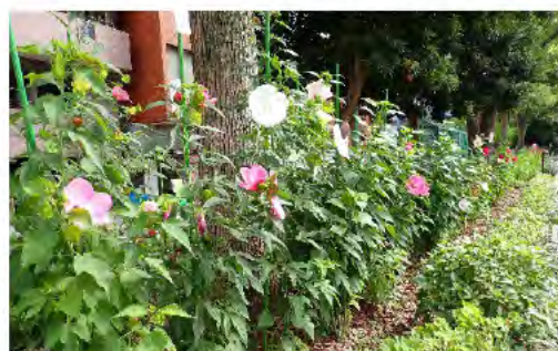
見事に咲いた大輪のタイタンピカス