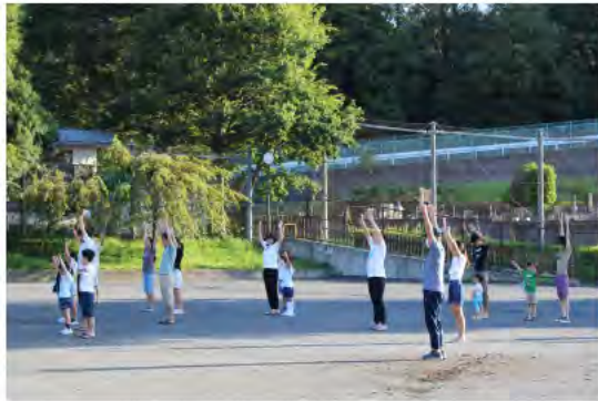
ラジオ体操の様子