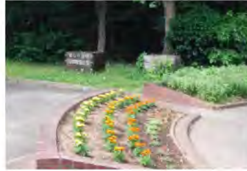
いつもきれいな花壇