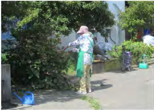
アジサイの刈り込み