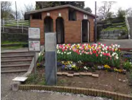
手入れの行き届いた花壇