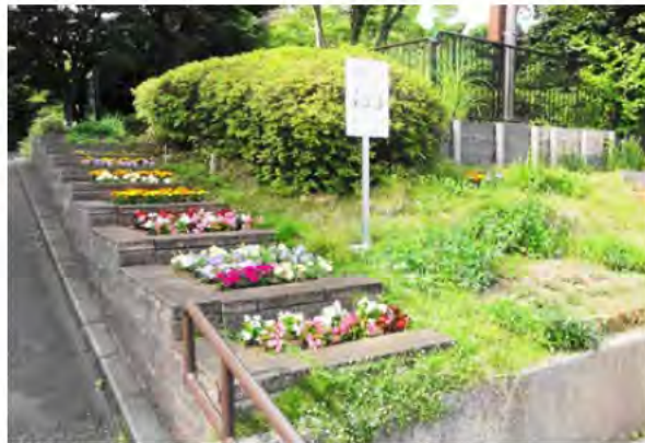
斜面地を生かした段々