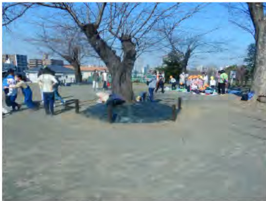
プレイパークで遊ぶ子どもたち