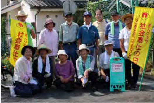
公園愛護会の皆さん