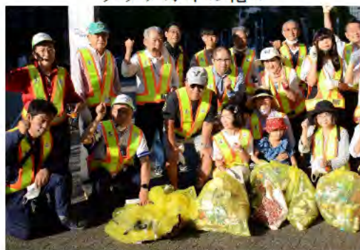
みんなで集まって清掃活動