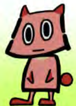
公園愛護会キャラクター あいごぼん