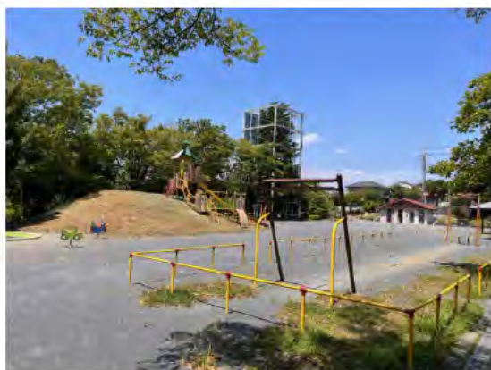
大場かやのき公園