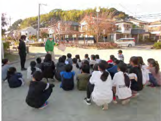
小学生に愛護会活動について説明する様子