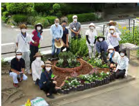
花壇の手入れ講座受講