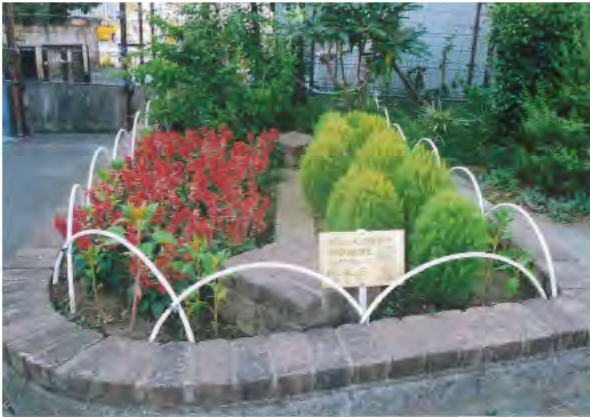
色鮮やかな区民の花 サルビア