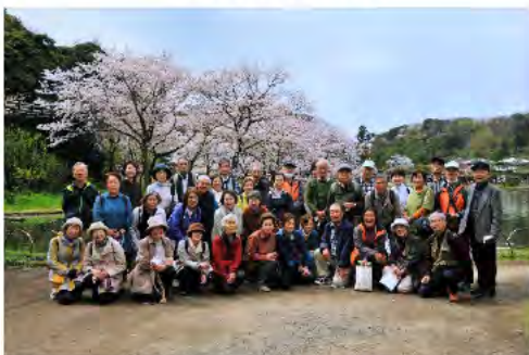
ウォーキングの様子

金沢区公園ボランティアの会は、区内の公園愛護会の支援団体です。メンバーのほとんどが公園愛護会員で約60名が在籍しています。