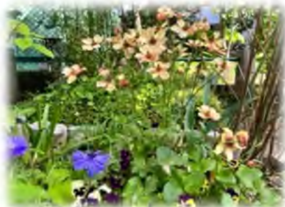
ラナンキュラス・ラックス