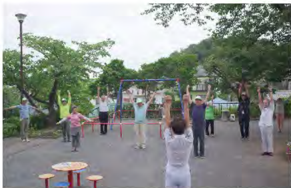
清掃活動後のラジオ体操