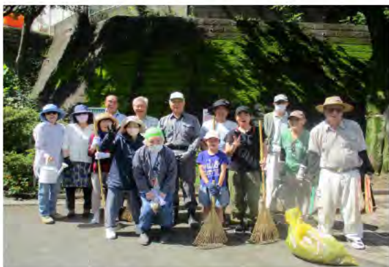
清掃後の愛護会の皆さん