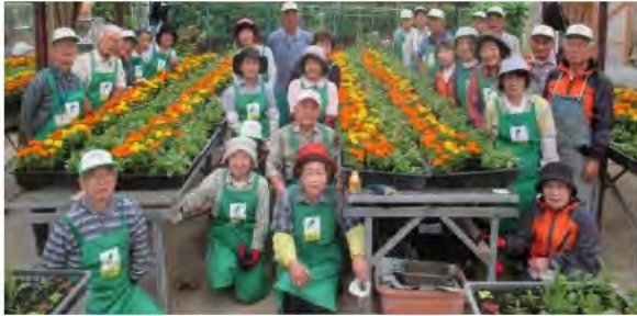
メンバーの皆さん