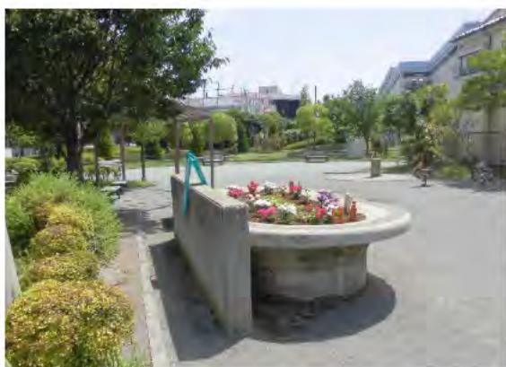
公園の中央にある手入れされた花壇