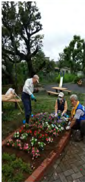
花苗植え付けと「弘法池」のいわれ