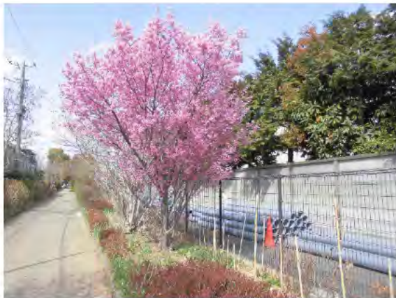
四季折々に花が楽しめる緑道