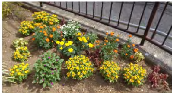
配置の色合いが考えられた花壇