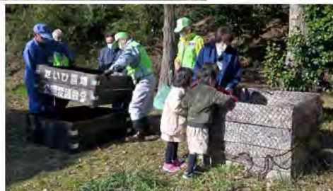
堆肥置き場作り講習会の様子