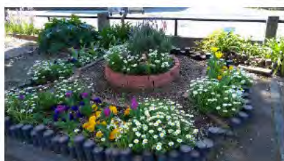
花壇の手入れ講座で作った花壇