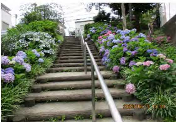
色とりどりのアジサイロード