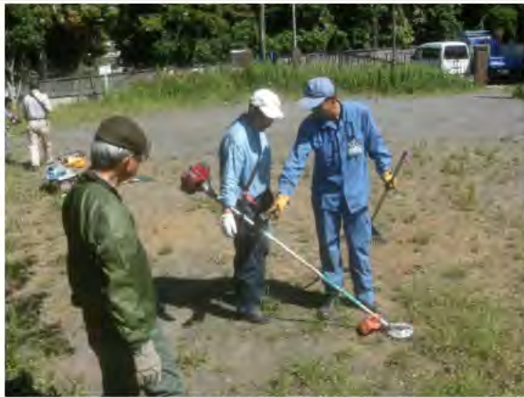
草刈り機講習を受講