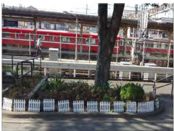
駅前にある珍しい立地の公園