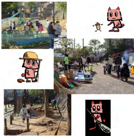
一斉清掃と焼き芋大会