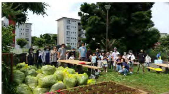
愛護会と地域の皆さんとの一斉清掃