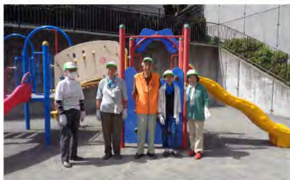
黒一点。会長を囲む愛護会メンバー