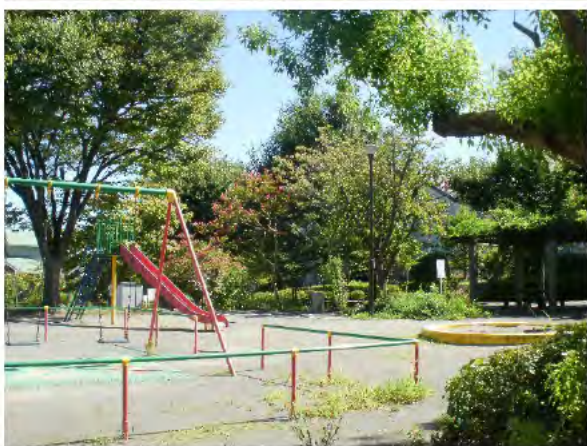
西が岡二丁目第二公園