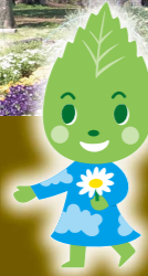
横浜みどりアップ 葉っぱー