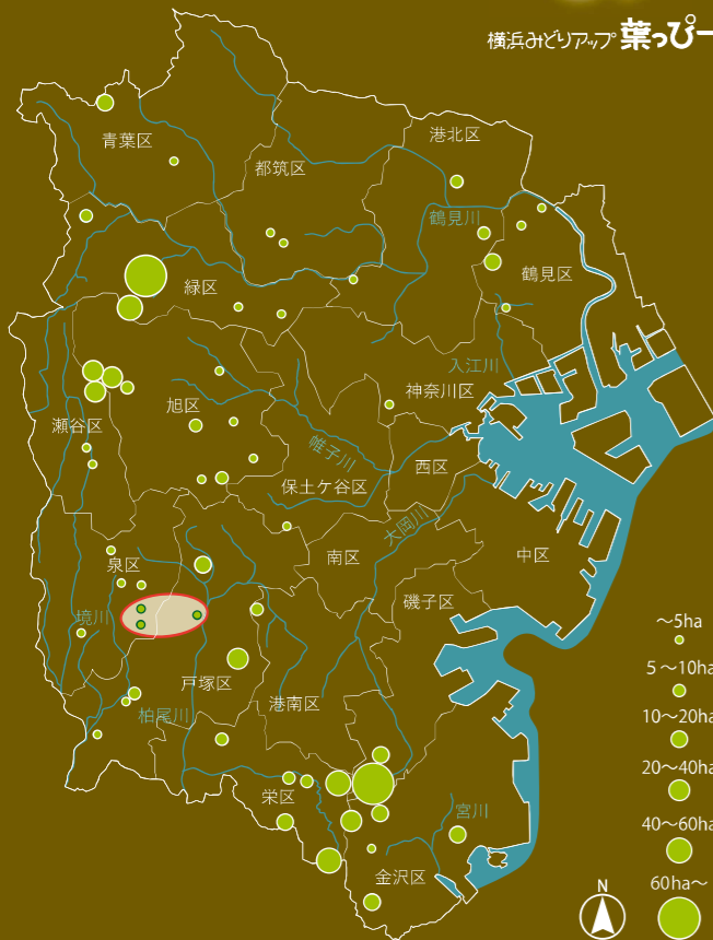
市民の森、ふれあいの樹林の場所・面積