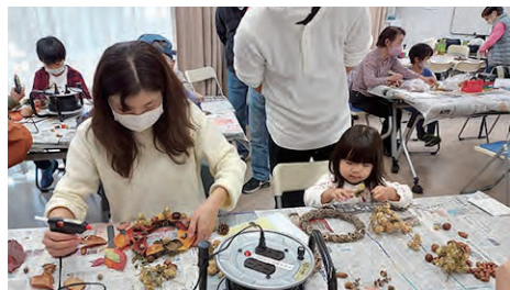
落ち葉を使ったリースづくり