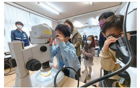
子ども向けの顕微鏡を使ったお話し会