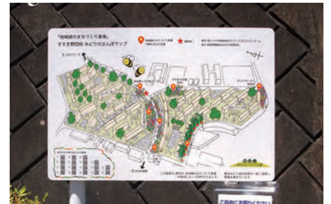
すすき野団地 みどりのさんぽマップ