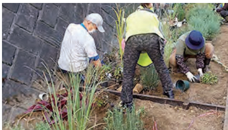
メドウガーデンの植栽作業の様子