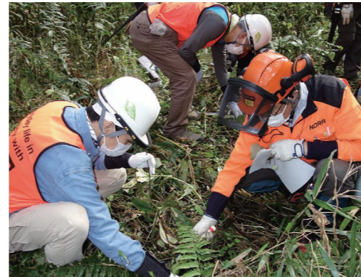
「横浜市の森づくり塾!」の様子