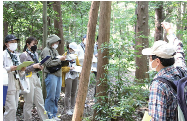
「横浜市の森づくり塾!」の様子