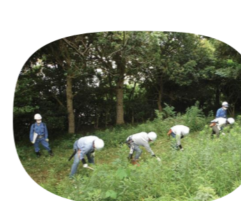
道具の使い方研修

横浜市では森に関する知識や安全に活動を行っていたためにさまざまな研修を行っています。森に関する知識、技術を学んでみてはいかがでしょうか。