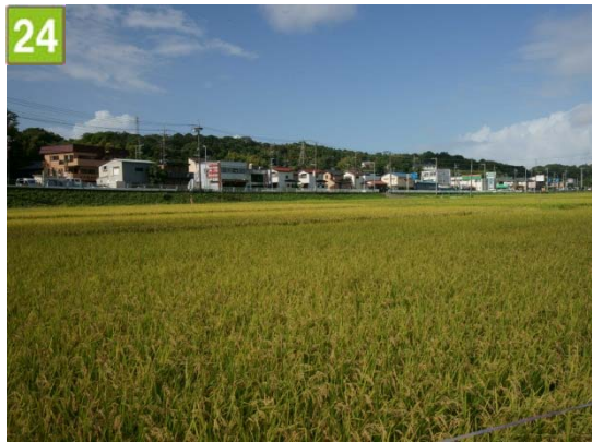
24 水田保全契約奨励事業（田谷町）