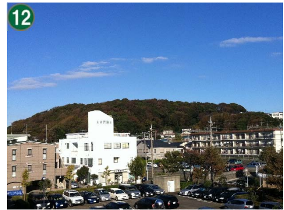
特別緑地保全地区指定等拡充事業（特別緑地保全地区：飯島地区）