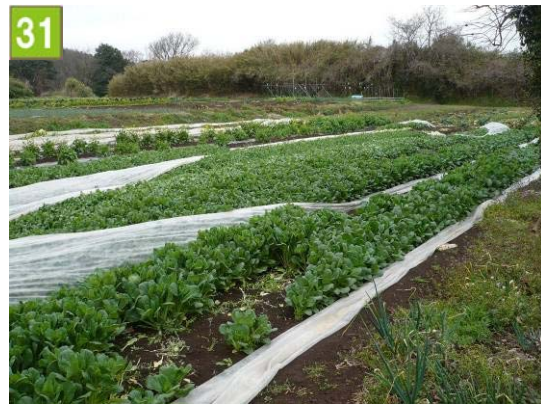
31 農地貸付促進事業（田谷町）