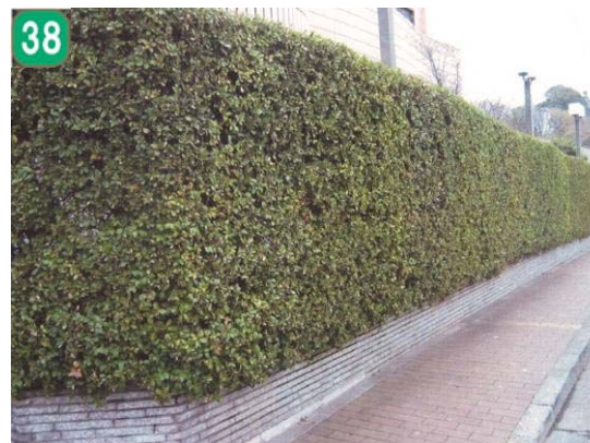
38 公共施設緑化管理事業（栄図書館）