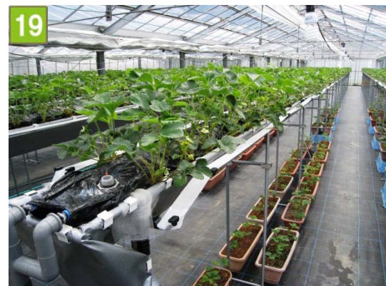
収穫体験農園の開設支援事業（小菅ヶ谷三丁目）