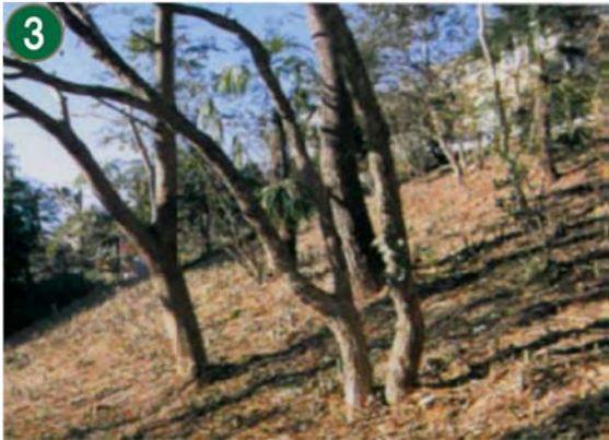
緑地再生等管理事業[市民の森等の手入れや下草刈り]（小菅ヶ谷四丁目緑地）