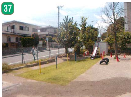
37 公共施設緑化事業（上郷保育園）