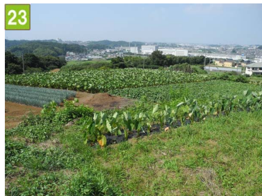
集团的農地の維持管理奨励事業（横浜市栄区长尾台土地改良区）