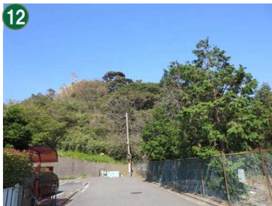
特別緑地保全地区指定等拡充事業（緑地保存地区）