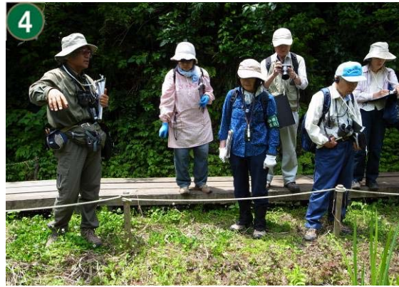
市民協働による緑地維持管理事業（荒井沢市民の森）