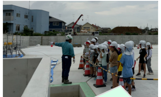
【放流口についての説明】

Q. 現場クレーンはどの程度の重さが吊れるの？ A. 最大吊り上げ荷重は4.9t