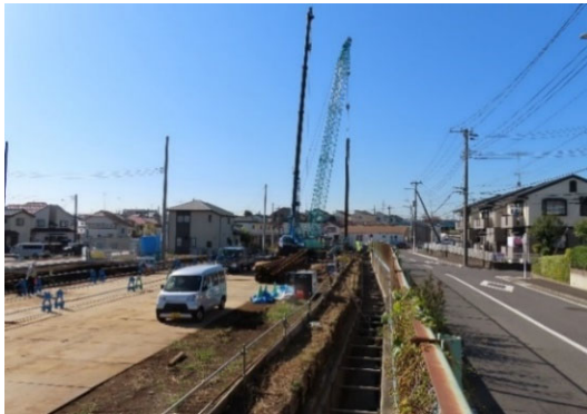
【東野水路改修の様子】

地区北側の東野水路の改修工事と宅地・道路の整備を進めており、一部の宅地と道路は整備が完了しています。東野水路の改修後は、水路は地下化され、その上は歩道になります。現在は、既存水路の撤去およびBOXカルバート（地下水路となる箱形のコンクリート構造物）の設置へ向け、土砂が崩れないよう地中に矢板を打ち込む作業を行っています。