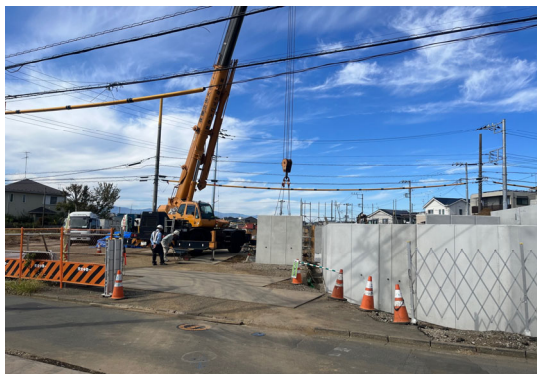
【擁壁設置工事の様子】

地区西側の都市計画道路や宅地等の整備を進めており、一部の宅地の整備が完了しています。引き続き、道路の下に埋設する電線共同溝や下水道工事のほか、宅地整備工事を進めていきます。