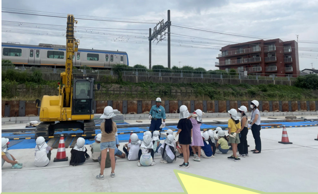
【工事車両についての説明】

Q. 現場クレーンはどの程度の重さが吊れるの？ A. 最大吊り上げ荷重は4.9t