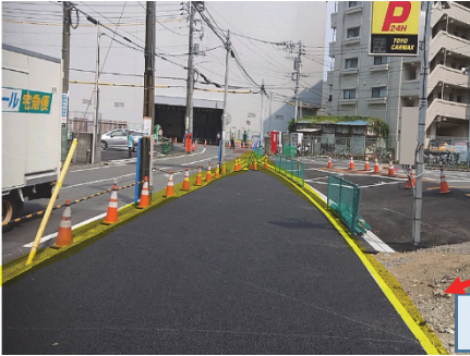
工事中の仮設歩道

道路拡幅用地としてお譲りいただいた土地に、仮設歩道の設置工事を行っています。これにより、歩行者の危険が緩和されることが期待されます。用地取得にご理解をいただきました土地所有者様にお礼申し上げます。