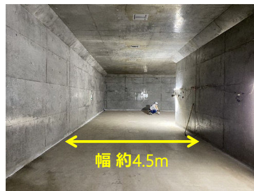
綱島方出入口の通路の一部が完成しました。↑ ↓ 壁や床などは今後工事が行われます。

昨年9月から工事を進め、今年の3月には綱島方出入口につながる通路のうち、下図黄色箇所が概ね完成しました。5月からは下図赤色箇所の工事に着手していきます。