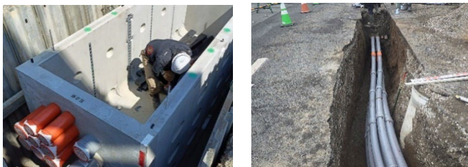
電線共同溝を設置している様子

現在、網島日吉線の地下に電線共同溝の整備を進めています。地区内の整備が完了した後、電線類の共同溝内部への敷設、電柱の撤去が行われます。