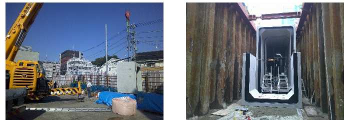
【北側調整池】コンクリート製の構造物を所定の位置にクレーンを使って運ぶ様子

84号線（北側）及び網島日吉線（南側）に新たに整備する歩道の地下で整備を進めています。南側の調整池では本体に接続する下水管を整備しており、北側の調整池では本体の設置を行っています。