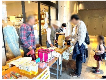
大人気のガラポン