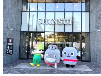
港北区キャラクター「ミズキー」たち