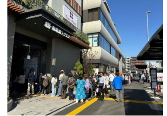
多くの方がご来場された様子

8月24日・25日の2日間にかけて行われた諏訪神社御祭礼では、 お神輿の出発場所として中央広場が活用されました。