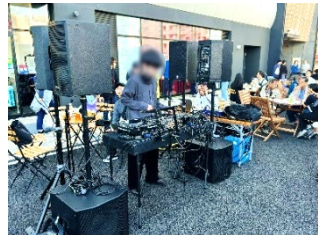
中央広場に設けられたDJブース