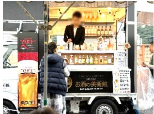
大人気のキッチンカー