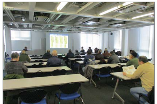
まちづくり構想検討会「第5回」の様子

各日、これまでの検討のまとめとして作成した「鶴ヶ峰駅北口周辺地区まちづくり構想（案）」をご説明し、合わせて、構想策定に向けた市民意見募集等の今後の手続きの流れをご説明しました。