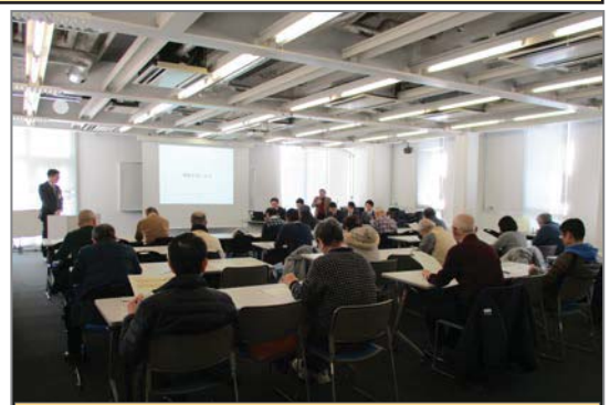
まちづくり構想検討会「第6回」の様子

鶴ヶ峰駅北口周辺地区における「プラン策定等」に向けた「協働による検討」の方法を示していますので、お時間のある際にご確認ください。