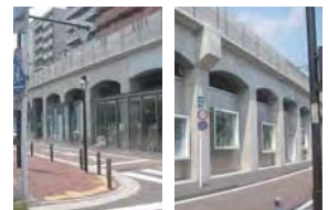
日ノ出スタジオ・黄金スタジオ(日ノ出スタジオ:中区日ノ出 黄金スタジオ:中区黄金)