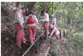
鴨居原市民の森を憩いの森にする活動(鴨井原市民の森愛護会)