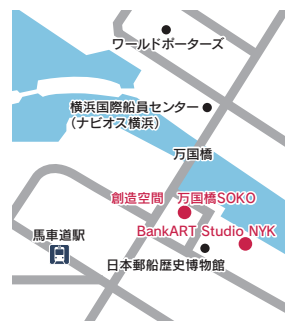
所在地 中区海岸通