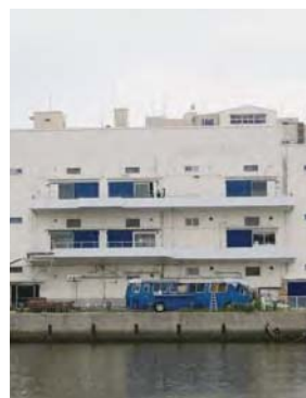
▲BankART Studio NYK

BankART Studio NYKは、現代美術をはじめとする作品展示や公演の場所として、NPO法人によって運営され、国内はもとより広く海外からも注目されている。万国橋SOKOは、建築家、デザイナーやアーティストが入居し、クリエイティブな活動の場所として活用されている。この2棟の建物は、物流施設として建設された倉庫建築であり、いずれも海岸通りや万国橋近くの内水面に面して建ち、かつての港湾施設の面影を残しつつ、新しい都市的な活動や文化的なにぎわいを創出する拠点としても機能しており、戦後の建物を効果的にリノベーションした好例である。(関委員)