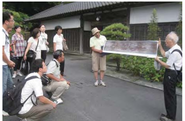
▲江戸時代の高札の説明