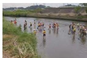
鶴見川流域での清掃・学習・人材育成活動(特定非営利活動法人鶴見川流域ネットワーク)