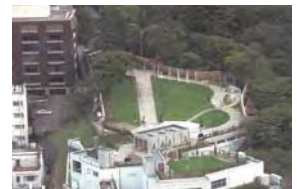
アメリカ山公園(中区山手町)