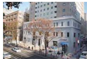
ストロングビル(中区山下町)