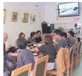
▲店内でランチ風景