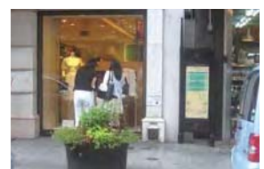
元町ペットバー(中区元町)