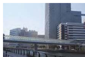
はまみらいウォーク(西区高島2丁目～1丁目)