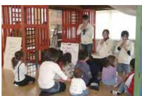
山下公園のコンビニエンスストアで子育て支援活動(ハッピーローソン山下公園店)