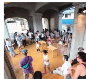
▲かいだん広場でのイベント