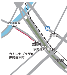
所在地 中区吉田町