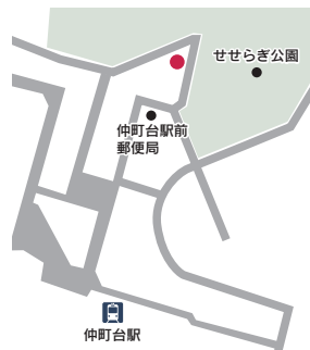
所在地 都筑区仲町台