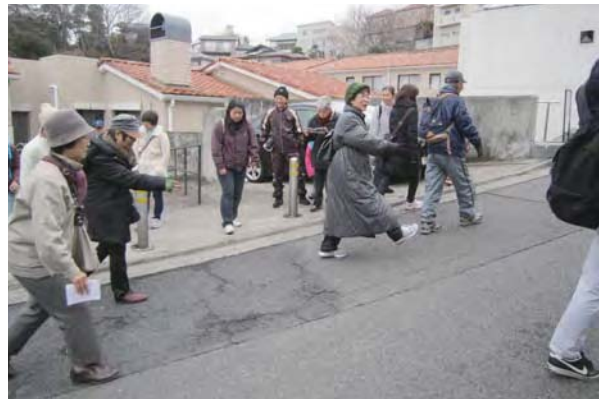
▲まち歩きで課題発見