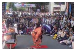
野毛大道芸でまちおこし(野毛大道芸実行委員会)