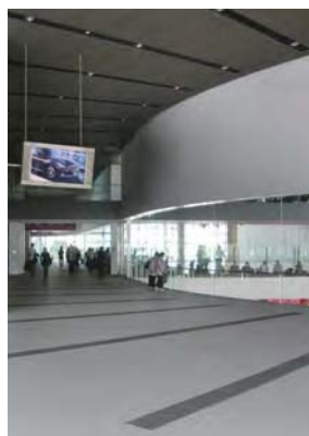
▲日産グローバル本社 NISSAN ウォーク