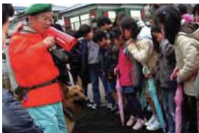
助け合いの精神で港南エリアを中心とした住民生活をサポート(さわやか港南)