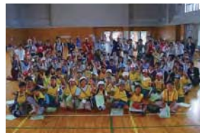
つぎのみんなで元気なまちづくり(特定非営利活動法人 1 Love つぎ)