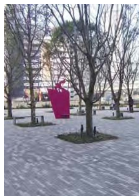
▲横浜三井ビルディング公開空地