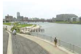
鶴見川河口干潟「貝殻浜」(鶴見区生麦5丁目)