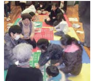
▲「てらお昔遊び祭り」の風景