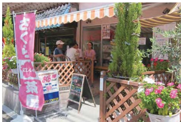
▲店さきにはテラス席もあります