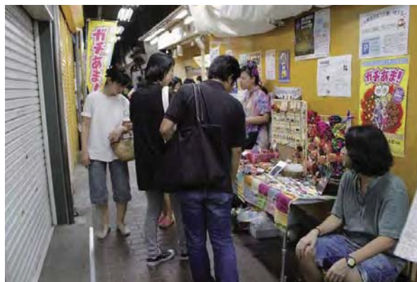
▲フリーマーケットの様子