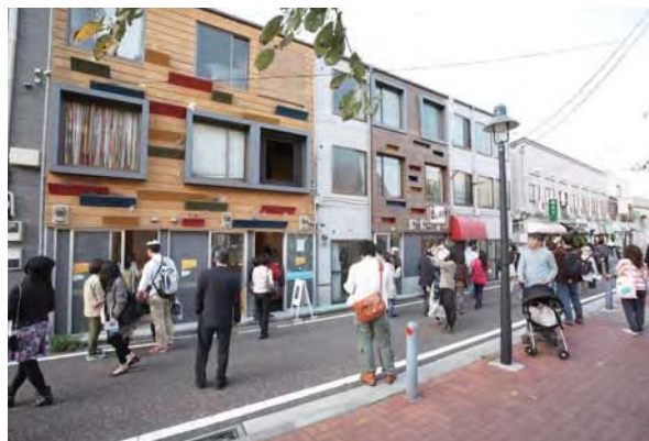
▲黄金町バザールの模様