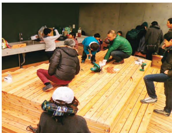
木製デッキの天板は子どもも含めた地域住民が張った。

パン屋は、商店街関係者の協力を得て新築されるビルに入ることになります。より地域の活性化につなげようと、大学の学生たちも加わり、建物の活用について検討を進めていきました。そこで見えてきたのは、新たにできるパン屋にはイートインスペースの設置は難しく、加えて商店街にはミニ広場がないため、焼きたてのパンを食べながら、ゆっくりできる場が必要ということでした。 また、地域には子育て世代が過ごせるような、多世代が混じり合う場がないことも地域の課題として分かりました。 そんな中、学生から『ヨコハマ市民まち普請事業』に応募してみたい』という声があり、「まち普請」への挑戦を決めます。新築ビルの屋上に、地域の方が気軽に立ち寄ることができる屋上広場の整備を提案内