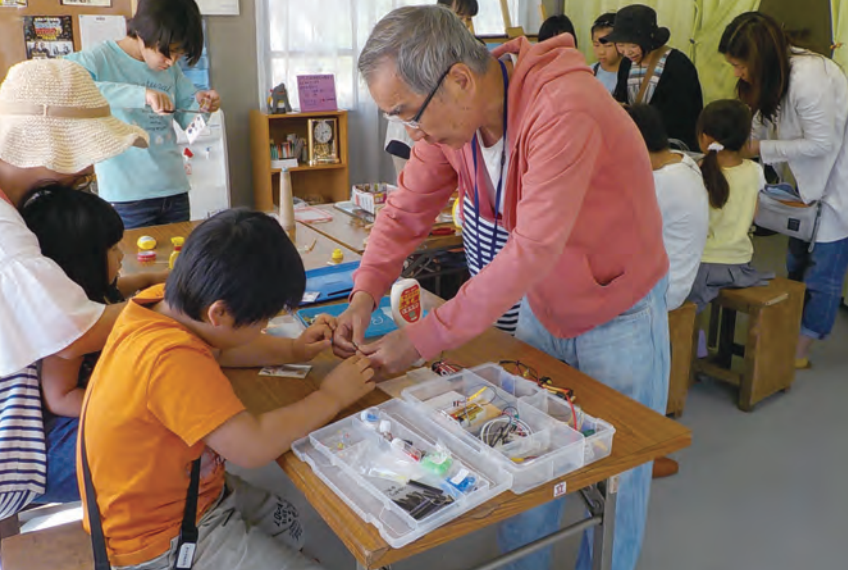
子ども向けの工作クラブの他にも、手作り教室などを定期的に開催。

ような状況の中で「雨風がしのげ て、みんなが集まることのできる場 所があるといいね」という意見が 出ていました。そこで、公園愛護 会が中心となり「三ノハマ市民まち 普請事業」に応募することとなり ました。