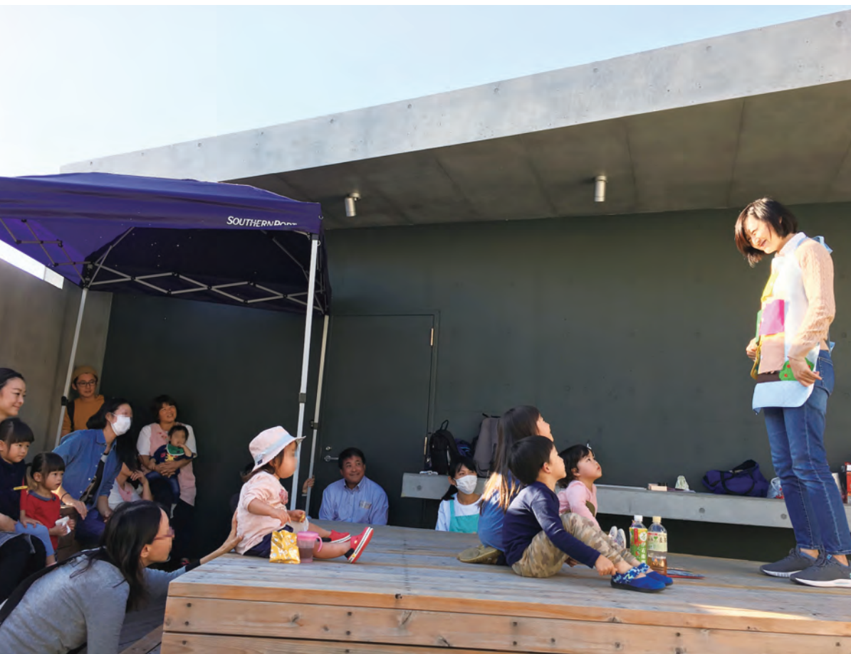
日常的に施設を開放していることに加えて、子育て世代や子どもたち向けのイベントなどでも活用している。

容にして一次コンテストに応募しました。 しかし、一次コンテストはギリギリでの通過。「若い世代の勢いだけでは難しい」と気付いた皆さんは、