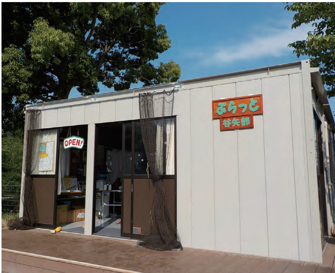
「ぷらっと 谷矢部」の看板は近隣の住民の方が手彫りでつくったもの。

「ぷらっと 谷矢部」は、横浜市営地下鉄ブルーライン踊場駅から徒歩約10分の戸塚区矢部町にある谷矢部公園の中にあります。谷矢部公園は、池や樹林地、湧き水を利用したせせらぎ、竹林などの豊かな自然と、多目的グラウンドや複合遊具が整備され、多くの方々に親しまれている公園です。