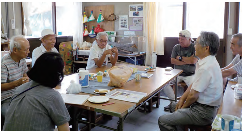
拠点ができただけで、地域の方々がゆっくりと談笑する機会も増えている。

様々な団体が公園で活動するため、利用調整やイベント開催の会議をすることが多くありましたが、