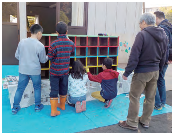
棚や椅子などの備品は、寄贈品を子どもたちと一緒に色を塗るなどして活用している。

地域のインテリジェンス「ぶらっと谷矢部」づくり(戸塚区) 整備主体…谷矢部池公園愛護会 整備場所…戸塚区矢部町 谷矢部池公園 整備内容…交流拠点(作業スペース、ギヤラ リースベース等) 協力企業…大洋建設株式会社 竣工時期…平成30年3月