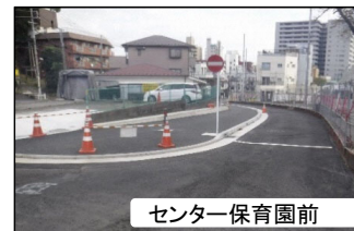
センター保育園前

このため、バス通り~八幡前二見台線区間(下図のピンク部分)は、年内に完了する見通しですが、センター保育園~東側道路区間(下図の黄色部分)は、年明けから本格着手し、2月完了に向けて工事を進めていくことになりました。地元の皆様には大変ご不便をお掛けしますが、早期完了に向けて取り組みますので、ご理解、ご協力の程よろしく申し上げます。